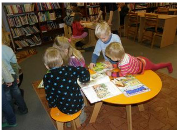
Foto: Grāmatu iepazīšana RCB Bišumuižas filiālbibliotēkā