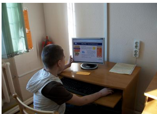
Foto: Viktorīna par RCB bērnu mājaslapu RCB filiālbibliotēkā "Zemgale"

Daudzveidīga informācija par kādu noteiktu tematu visbiežāk ir nepieciešama skolēniem un studentiem mācību procesā. Viņi visvairāk izmanto dažādus avotus informācijas iegūšanai - RCB krājumu, Latvijas publisko bibliotēku elektroniskos katalogus, autorizētās datubāzes, interneta resursus u.c. Ne reti skolēnu prasmes iegūt, atlasīt un novērtēt informāciju ir nepietiekamas, tāpēc RCB filiālbibliotēkās tika veidotas bibliotekārās stundas – dažās filiālēs bija izstrādāts secīgs plāns informācijprasmes apgūšanai, citās - atsevišķas nodarbības. Bieži bibliotekāro stundu atsevišķi elementi tika izmantoti bibliotēkas iepazīšanas ekskursijās, kā arī tematiskajos pasākumos. Raksturīgi, ka šie pasākumi bija veidoti,