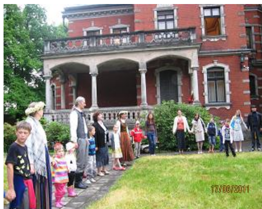
Foto: RCB Sarkandaugavas filiālbibliotēkas un filiālbibliotēkas "Rēzna" lasītāju ciemošanās muzejā

Veidojot pasākumus bērniem un jauniešiem, RCB bibliotekāri bijuši radoši - izmantotas visdažādākās formas un metodes, bet populārākās: