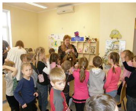
Foto: RCB filiālbibliotēkas "Vidzeme" iepazīšana