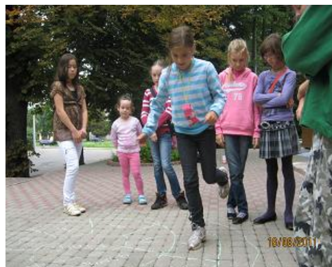
Foto: RCB Sarkandaugavas filiālbibliotēkas lasītāju aktivitātes pagalmā