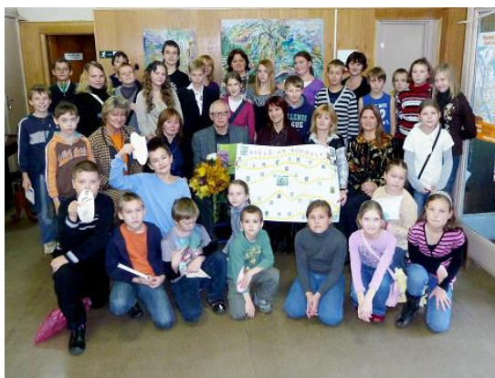
Foto: RCB Ķengaraga, Pļavnieku filiālbibliotēku un filiālbibliotēkas "Rēzna" kopīgs pasākums

Izvērtējot pasākumu kopumu bērniem un jauniešiem jāsecina, ka tas ir bijis ļoti intensīvs – RCB organizēti 1564 pasākumi, no tiem bērniem - 1011 (t.i. 65%). 2011. gadā vērojama vēl aktīvāka pērn aizsāktā RCB filiālbibliotēku "saudzības pasākumu" organizēšanas prakse, kad kādas filiālbibliotēkas lasītāju – interesentu grupa kopā ar bibliotekāru piedalās citas filiālbibliotēkas rīkotajā pasākumā. Šādus kopīgus pasākumus lasītājiem organizēja RCB Pļavnieku, Daugavas, Ķengaraga, Sarkandaugavas filiālbibliotēkas un RCB filiālbibliotēka "Rēzna", piemēram, kopīga Jāņu ielīgošana Sarkandaugavā, tikšanās ar rakstnieku Māri Runguli, pasākums "Randiņš ar Viku" u.c. Kopdarbā, apvienojot resursus, sadalot pienākumus, tika panākta augstāka pasākumu kvalitāte, ko apliecina bērnu vēlme šādos pasākumos piedalīties atkārtoti.