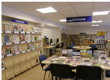
Foto: RCB Biķernieku filiālbibliotēkas bērnu zona

Gada laikā notikušas vairākas būtiskas izmaiņas, kas ietekmējušas bērnu un jauniešu apkalpošanas kvalitāti - atvērta renovētās RCB Biķernieku un Jaunciema, Imantas filiālbibliotēkas, kurās gaišās un skaistās telpās ir izvietots kvalitatīvs krājums, veidots bērniem atbilstošs aprīkojums. Vairākās RCB filiālēs labiekārtotas bērnu nodaļu telpas (RCB Sarkandaugavas, Bolderājas filiālbibliotēkas un RCB filiālbibliotēka "Rēzna"), papildināts rotaļlietu un galda spēļu klāsts (RCB Čiekurkalna, Sarkandaugavas, Jaunciema, Juglas filiālbibliotēkas un RCB filiālbibliotēkas "Kurzeme", "Pārdaugava", "Vidzeme"). Pozitīvo izmaiņu darbs RCB turpinās – 2011. gada nogalē uzsākti remonta un telpu labiekārtošanas darbi Rīgas Centrālajā bibliotēkā (Brīvības iela 49/53) un RCB Šampētera filiālbibliotēkā, kur speciāli bērniem un jauniešiem top jauna nodaļa.