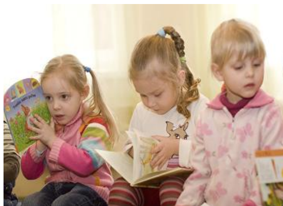
Foto: Mazuļi RCB Sarkandaugavas filiālbibliotēkā