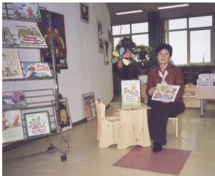
Rīgas Centrālās bibliotēkas bērnu literatūras nodaļa