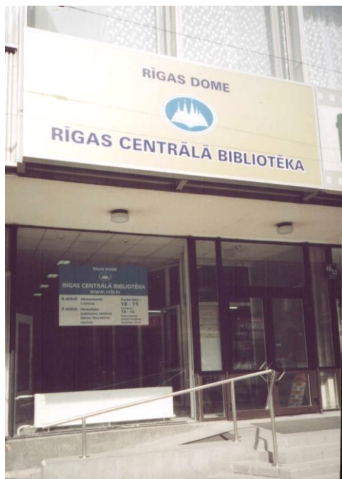
Rīgas Centrālās bibliotēkas izkārtne

Kā interesanta bibliotēku publicitātes forma parādās arī vides (āra) reklāma . Vairākām filiālbibliotēkām izgatavotas jaunas izkārtnes (Šampētera, Čiekurkalna, Grīziņkalna, Hanzas, Nordeķu filiālbibliotēka, filiālbibliotēka „Zemgale”, „Strazds”, „Tilts” u.c.), pie ēkas Brīvības ielā 49/53 izvietota oficiāli apstiprināta Rīgas Centrālās bibliotēkas izkārtne. Par Ziemeļblāzmas filiālbibliotēku informē reklāma pie lielveikala “Rimi”. Tāpat tiek domāts arī par bibliotēku skatlogu noformējumu (Grīvas filiālbibliotēka un filiālbibliotēka “Laima”).