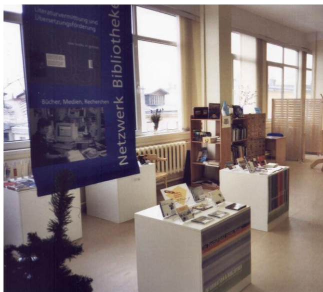
Gētes institūta Rīgā izstāde Rīgas Centrālajā bibliotēkā