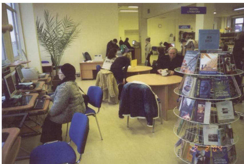
Rīgas Centrālās bibliotēkas Pieaugušo literatūras nodaļa