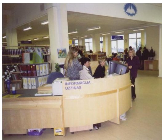
Rīgas Centrālā bibliotēka