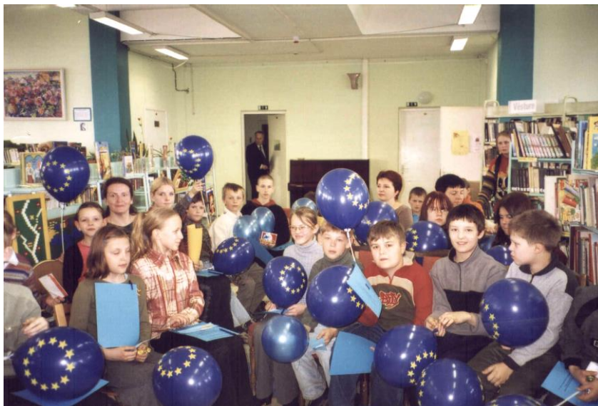
Eiropas nedēļas pasākums Rīgas Centrālajā bibliotēkā

Bērniem tiek organizētas literatūras izstādes un bibliotekārās stundas, rīkotas ekskursijas un dažādi pasākumi: tematiskie literatūras popularizēšanas pasākumi, konkursi, viktorīnas, leļļu izrādes, koncerti, balles, zīmējumu un rokdarbu konkursi un izstādes, karnevāli, videofilmu seansi u.c.