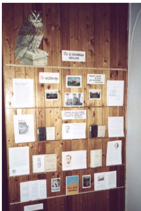
Filiālbibliotēkas “Vidzeme” vēstures izstāde

Par novadpētniecības kartotēkām un datu bāzēm skat. sadaļā “Uzziņu un informācijas darbs”.