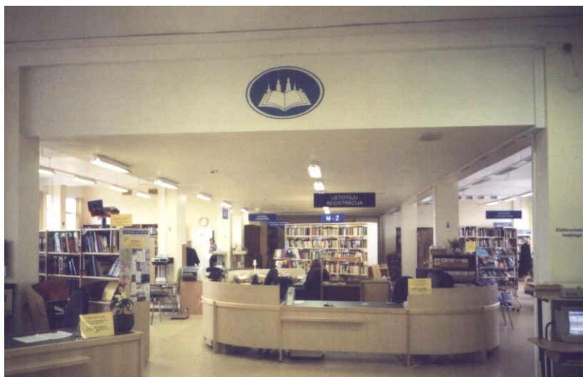
Rīgas Centrālās bibliotēkas Pieaugušo literatūras nodaļa

RCB Pieaugušo literatūras nodaļā darbojas Eiropas Savienības informācijas punkts.