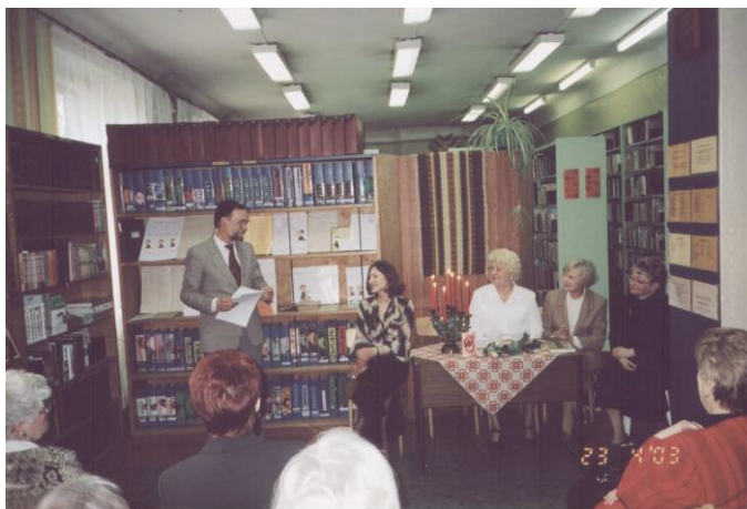
Grīziņkalna filiālbibliotēkas 80 gadu jubileja