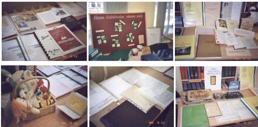
Bibliotēku vēstures izstādes materiāli

filiālbibliotēkas. Šo bibliotēku vēsture tika prezentēta ļoti atraktīvi, izmantojot piedāvātās tehniskās palīgierīces, iepriekš sagatavotus uzskates materiālus un pat pēdējā brīdī prezentācijas telpā ieraudzītus un atraktīvi apspēlētus rekvizītus, iepazīstinot ar interesantiem faktiem un dokumentiem., jautriem atgadījumiem un precīzi iekļaujoties noteiktajā laikā. Pasākumu papildināja plaša līdzpaņemto bibliotēku vēstures dokumentu izstāde. Bibliotēkas vēstures prezentācijas pasākums notika bibliotēkas “Zemgale” telpās darbdienu garumā un noslēdzās precīzi programmā norādītajā laikā. Prezentācija bija konkursa darbu pirmās “ugunskristības”.