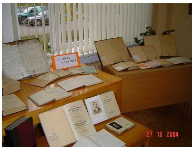
Sarkankalna filiālbibliotēkas 80 gadu jubilejai veltītā izstāde „Iz mūsu pagātnes”

"Rezumējot- šis gads izveidojās par savdabīgu atskaites punktu visam bibliotēkas pastāvēšanas 80 gadu ilgajam mūžam." , rakstīts Sarkankalna filiālbibliotēkas gada pārskatā.