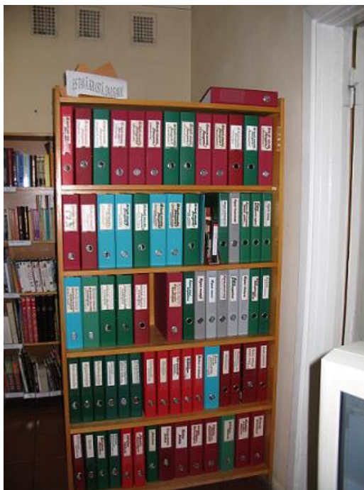
Novadpētniecības materiālu mapes Daugavas filiālbibliotēkā

mapes tika papildinātas un rediģētas, pārstrukturētas jau esošās un daudzas tapušas no jauna. Piemēram, Pļavnieku filiālbibliotēkā izdalīta atsevišķa mape "Pļavnieku filiālbibliotēka", kurā apkopoti raksti par bibliotēku periodiskajos izdevumos. Sarkandaugavas bibliotēkā izveidota mape "Sarkandaugavas bibliotēkas vēsture." Atsevišķa mape bibliotēkas vēsturei ir izveidota arī filiālbibliotēkai "Vinnijs." Mapēs sevišķi papildinājušās atmiņu, publikāciju par bibliotēku, administratīvo dokumentu, atzinības rakstu, apsveikumu sadaļas.