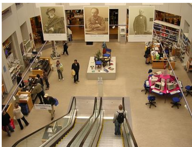
Kopenhāģenas Centrālā bibliotēka