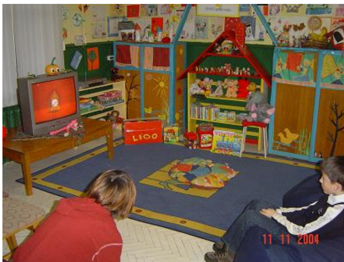
Lego spēļu māja Mārtiņa bērnu filiālbibliotēkā

Sarkandaugavas filiālbibliotēkā mazo lasītāju ērtībai iekārtota telpa, kur bērni var brīvi komunicēt, kā arī izveidota periodikas lasītava 2.stāvā. Filiālbibliotēkā “Strazds” bērniem atvēlēta atsevišķa telpa, kas iekārtota ar bērniem piemērotu aprīkojumu un rada patīkamu, ērtu vidi bibliotēkas lietotājiem. Pārskata gadā Torņakalna filiālbibliotēkas bērnu literatūras nodaļa tika aprīkota ar jaunām mēbelēm un ieguva jaunu un mūsdienīgu, vizuāli pievilcīgu veidolu, piesaistot dažādu vecuma grupu bērnu uzmanību nodaļai gan kā informācijas izguves, gan izklaides vietai. Zemitānu filiālbibliotēku bieži apmeklē bērni kopā ar vecākiem, tāpēc bibliotēkā ir izveidots plaukts ar nelielu krājumu bērniem. Zemgales filiālbibliotēkā jūnijā notika akcija “Gatavosimies skolai savlaicīgi” ar iespēju noskatīties 12 latviešu videofilmas, kas piemeklētas, atbilstoši skolu mācību programmām visām vecuma grupām. Filiālbibliotēka “Zvirbulis” strādā ar lasītāju grupu – mūsu sētas bērni. Tie ir mazi bērni, kas bibliotēku apmeklē bez pieaugušajiem. Šiem lietotājiem sagādātas spēles un rotaļlietas, bērni var zīmēt, lasīt, rotaļāties bibliotēkā.