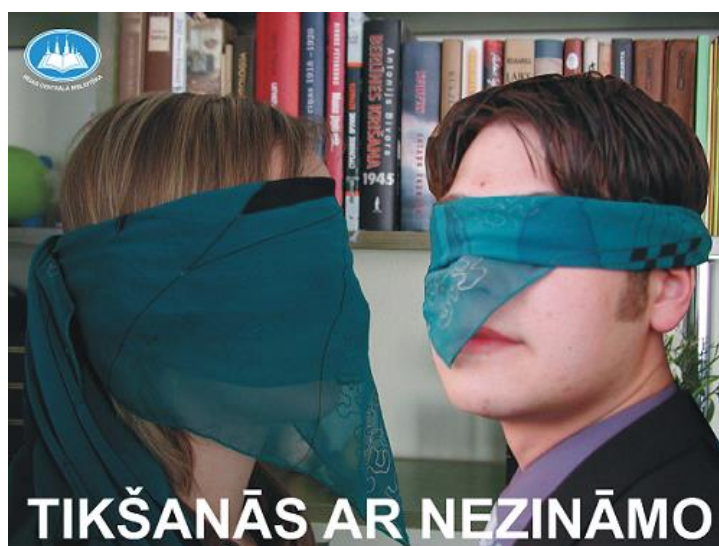
Akcijas „Tikšanās ar nezināmo” plakāts