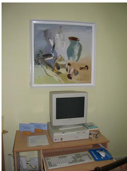
Datorvieta Daugavas filiālbibliotēkā