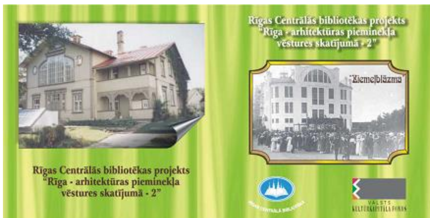
Kompaktdisks “Rīga – arhitektūras pieminekļa vēsturiskajā skatījumā – 2”

Kompaktdisks “Rīga – arhitektūras pieminekļa vēsturiskajā skatījumā – 2” guva Valsts KKF atbalstu. Tas veltīts kultūrvēsturisko objektu kompleksam tajā Vecmīlgrāvja daļā, kura pazīstama ar nosaukumu Ziemeļblāzma un kurā mājvietu radusi RCB Ziemeļblāzmas filiālbibliotēka. Disks apkopo materiālus par tādiem kultūrvēsturiskiem objektiem kā bezalkohola biedrība “Ziemeļblāzma”, Zaļā skola, Burtnieku nams u.c. laika posmā no 1886. līdz 1927.gadam. Kompaktdiski ietver ne tikai materiālu bibliogrāfiskos aprakstus, bet arī nozīmīgāko vienību pilnus tekstus. Materiāli aplūkojami arī RCB mājas lapā.