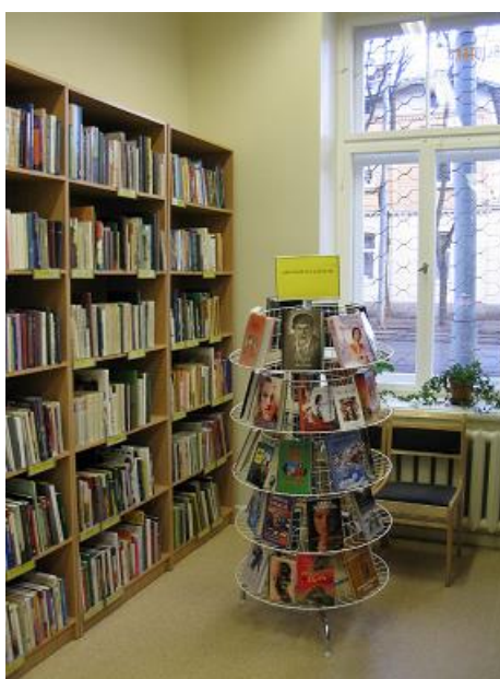
Filiālbibliotēka „Laima” pēc renovācijas

2004.gadā RCB un tās filiālbibliotēkas piedāvāja gan tradicionālus, gan netradicionālus bibliotekāros un informatīvos pakalpojumus; pēc veiktās renovācijas darbu atsāka filiālbibliotēka „Laima”.