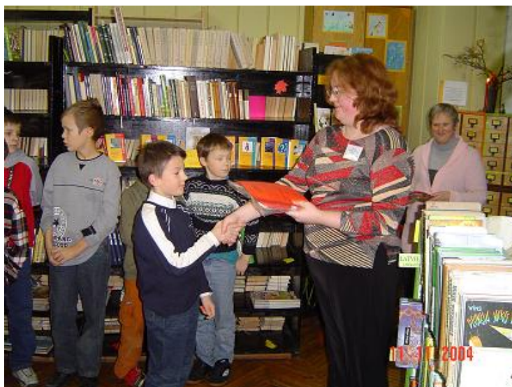
Čaklāko lasītāju sveikšana Mārtiņa bērnu filiālbibliotēkā