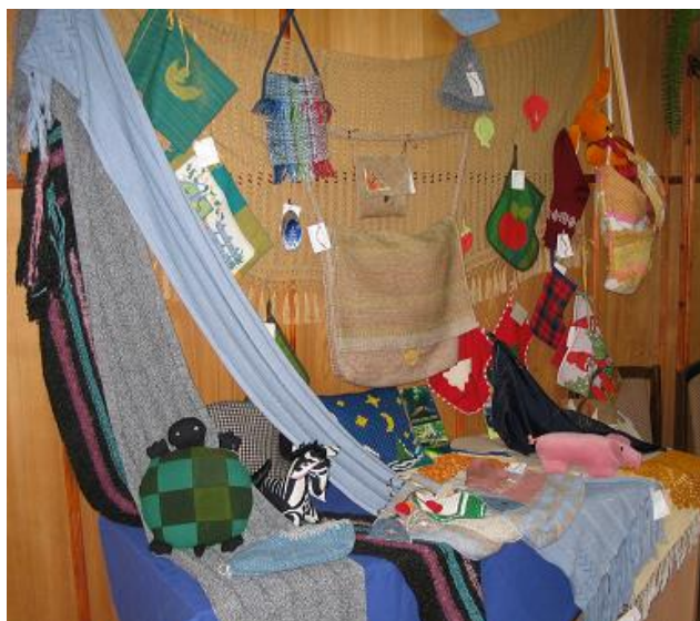
Dienas centra „Cerību tilts” audzēkņu darbi RCB Zaslauka filiālbibliotēkā

Zaslauka filiālbibliotēka jau otro gadu sadarbojas ar Dienas centru „Cerību tilts”. Centru apmeklē jaunieši ar uztveres traucējumiem. Tur jauniešiem ir iespēja nodarboties ar šūšanu, adīšanu un aušanu. Jauniešu radošo darbu ekspozīcijas – izšuvumi, šalles, adītas lelles, džemperī, apmetņi, paklāji un citi izstrādājumi ne vienu vien reizi priecēja bibliotēkas apmeklētājus. Zaslauka filiālbibliotēku aktīvi apmeklē un tās pakalpojumus izmanto Latvijas Nedzirdīgo savienības biedri – cilvēki ar dzirdes problēmām.