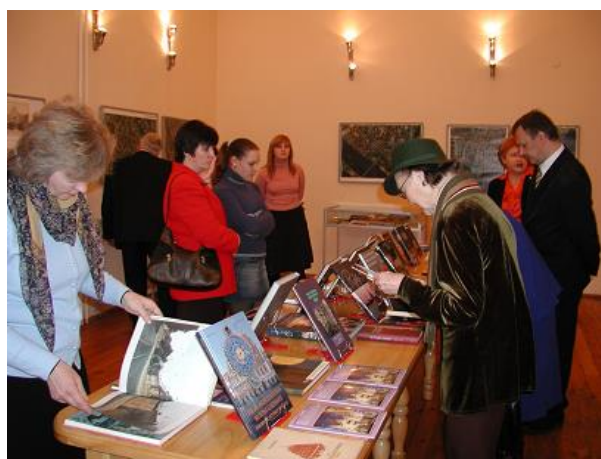
Izstāde „Rīgas gadsimtu silueti” Viļņas apgabala bibliotēkā

18. novembrī Viļņas apgabala bibliotēkā tika atklāta RCB speciālistu sagatavotā izstāde „Rīgas gadsimtu silueti” – grāmatas, litogrāfijas un kartes par Rīgas vēsturi, kultūrvidi, arhitektūru, mākslas un izglītības iestādēm, Rīgas parkiem u.c. Izstādes atklāšanā piedalījās Latvijas vēstniecības un Latviešu-Lietuviešu biedrības pārstāvji Lietuvā, Viļņas bibliotēku un sabiedrisko organizāciju vadītāji, bibliotekāri, žurnālisti, mākslinieki. Izstādē izliktie materiāli bija no RCB, kā arī specializētās Vecrīgas filiālbibliotēkas krājumiem.