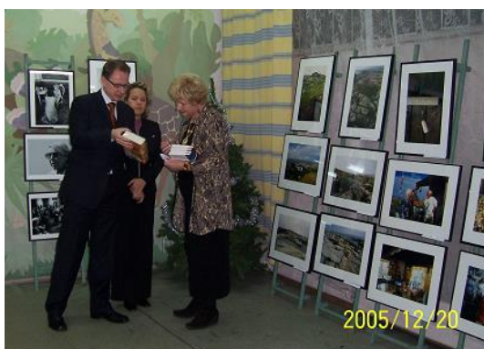
Izstādes pat Tūvi Jansoni atklāšanā Imantas filiālbibliotēkā