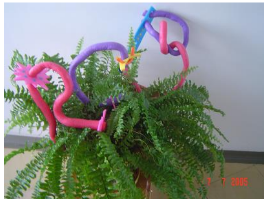
Izstāde „Trīs burvju burti RCB bērnu fantāzijās”

18. novembrī Viļņas apgabala bibliotēkā tika atklāta RCB speciālistu sagatavotā izstāde „Rīgas gadsimtu silueti” – grāmatas, litogrāfijas un kartes par Rīgas vēsturi, kultūrvidi, arhitektūru, mākslas un izglītības iestādēm, Rīgas parkiem u.c. Izstādes atklāšanā piedalījās Latvijas vēstniecības un Latviešu-Lietuviešu biedrības pārstāvji Lietuvā, Viļņas bibliotēku un sabiedrisko organizāciju vadītāji, bibliotekāri, žurnālisti, mākslinieki. Izstādē izliktie materiāli bija no RCB, kā arī specializētās Vecrīgas filiālbibliotēkas krājumiem.