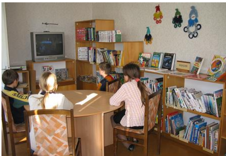
RCB Daugavas filiālbibliotēkas Bērnu literatūras nodaļā

Izvirzītie mērķi un uzdevumi tika panākti, pilnveidojot krājumus bērniem un jauniešiem, organizējot saturīgas bibliotekārās stundas, rīkojot atraktīvus literatūras popularizēšanas pasākumus un iesaistot dažāda vecuma bērnus citās bibliotēku rīkotajās aktivitātēs.