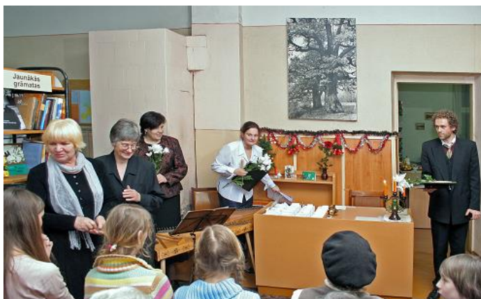
Ziemassvētku sarīkojums Bišumuižas filiālbibliotēkā

Tradicionāli kļuvuši bērnu bibliotēkās un nodaļās vasaras lasīšanas konkursi. Jau ceturto gadu Mārtiņa filiālbibliotēkas lasītāji – dažādu vecumu bērni priecājas par iespēju piedalīties vasaras lasīšanas konkursā „Mans grāmatu tārpiņš”. Grāmatu kasītāju uzdevums – izaudzēt pēc iespējas garāku grāmatu tārpiņu. Izlasot vienu grāmatu, ikviens no dalībniekiem, pievienoja tārpiņam vienu posmu. Rudenī bibliotēkā notika aktīvāko konkursa lasītāju apbalvošana.