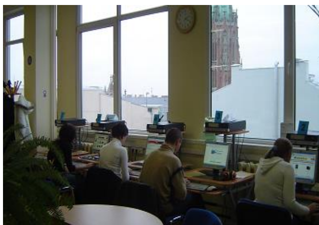
Datorvietas RCB Pieaugušo literatūras nodaļā

Valsts aģentūra „Kultūras informācijas sistēmas” saskaņā ar projekta „Valsts vienotā bibliotēku informācijas sistēmas” realizācijas plānu 2004.gadam Rīgas Centrālajai bibliotēkai funkciju nodrošināšanai, lai palielinātu bibliotēku sniegto pakalpojumu klāstu, apjomu, kvalitāti, konkurētspēju, 2005.gadā piešķir lietošanai RCB un tās filiālbibliotēkām 169 datorkomplektus ar standartprogrammatūru un arī iegādājas informācijas sistēmas ALISE 25 papildu licences.