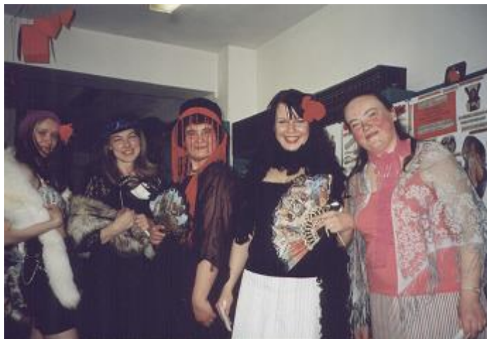
Karnevālā "Ak šī grāmatu pasaule, mīļotā un nīstā, izdomātā un īstā..."