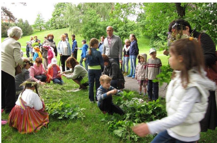
Foto: Pasākums ģimenēm "Jāņu ielīgošana", ko katru gadu organizē RCB Sarkandaugavas filiālbibliotēka sadarbībā ar Latvijas Nacionālā vēstures muzeja nodaļu "Dauderi"

Sadarbību ar skolām RCB bibliotekāri vērtēja, nosakot atzīmi skalā no 1 līdz 10. Kopumā iegūtā atzīme 7,7 ir uzskatāma par labu rādītāju, kur visaugstākais novērtējums (8-10) ir piešķirts 28 reizes un norāda uz savstarpēji ieinteresētu, labvēlīgu, radošu kopdarbu. Piemēram, metodiska palīdzība vidusskolas bibliotēkai novadpētniecības darbā un darbā ar LNB digitālo datu bāzi (RCB Čiekurkalna filiālbibliotēka) vai skolēnu projektu izstādes bibliotēkā, kas iespējams veicināja bibliotēkas apmeklējumu (RCB Bērnu literatūras nodaļa) u.c.