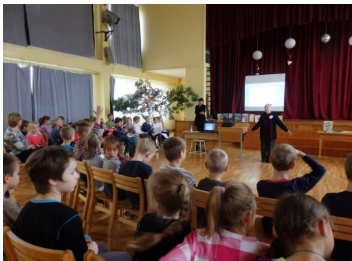
Foto: RCB filiālbibliotēkas “Zemgale” bibliotekāri skolā stāsta par grāmatām

Rīgā ir 12 speciālās skolas 4 , 30 speciālās pirmsskolas izglītības iestādes 5 un dienas rehabilitācijas centri bērniem ar īpašām vajadzībām. Vairākumam no specializētajām iestādēm ir sekmīga sadarbība ar kādu no RCB filiālbibliotēkām. Speciālo skolu skolēni iepazīna vārdnīcas, enciklopēdijas (RCB filiālbibliotēka “Zemgale”), uzzināja, kā kļūt par lasītāju, kādus žurnālus, spēles var izmantot bibliotēkā, kas ir “runājošās pasakas” (RCB filiālbibliotēkā “Strazds”), izzināja “Ābolu plauktu” un RCB bibliotēkas lietošanas noteikumus vieglajā valodā, mācījās blogā bērniem meklēt pasākumus (RCB filiālbibliotēka “Vidzeme”), piedalījās radošās aktivitātēs, rotaļās un kustību spēlēs (RCB Sarkandaugavas filiālbibliotēka un filiālbibliotēka “Rēzna”). Rehabilitācijas centra bērniem RCB Čiekurkalna filiālbibliotēkas bibliotekāri 2 reizes mēnesī veica grāmatu apmaiņu, regulāri iepazīstināja ar bērnu grāmatām tematiskajos apskatos, bet filiālbibliotēkā “Strazds” bija skatāmas vairākas bērnu un jauniešu ar īpašām vajadzībām darbu izstādes.