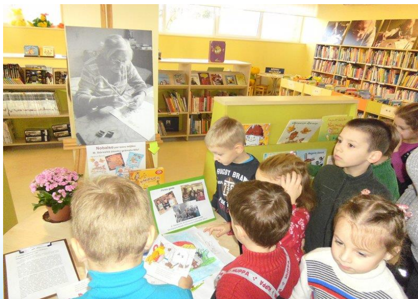
Foto: RCB Imantas filiālbibliotēkā pasākums par M. Stārasti

Bērnu grāmatu rakstnieces un ilustratores Margaritas Stārastes godināšanas pasākumi , atzīmējot 100 gadu jubileju, RCB filiālbibliotēkās tika rīkoti visa gada garumā. Izcilās rakstnieces dzīvi un daiļradi bērni iepazīna RCB Čiekurkalna, Grīziņkalna, Ilģuciema, Jaunciema, Juglas, Pļavnieku filiālbibliotēkās un filiālbibliotēkās “Zvirbulis”, “Zemgale”, “Avots”. Atraktīva bija bērnu darbošanās, veidojot leļļu izstādi pēc grāmatas “Viena maza pilsētiņa” motīviem, kupls dalībnieku skaits pulcējās “Zīļuka