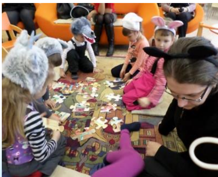
Foto: Pasākums "Tikšanās ar pasaku" mazuļiem kopā ar vecākiem RCB Bērnu literatūras nodaļā

Lasīšanas prieku bērnam ir jāapgūst ģimenē, tāpēc ļoti nozīmīga ir vecāku uzrunāšana, informēšana un padomdošana. Daudzās filiālbibliotēkās vecāki varēja iepazīt izdevumus par bērnu audzināšanu, attīstības posmiem, brīvā laika interesēm u.c. aktuāliem tematiem izstādēs, bērnu nodaļās izveidotajos tematiskajos plauktos (RCB Bērnu literatūras nodaļa, RCB Ilģuciema Grīziņkalna Šampētera filiālbibliotēkas un filiālbibliotēkas "Strazds", "Pārdaugava") un arī diskusijās par vecāku – bērnu attiecībām semināros "Laimīgā bērnība", kurus reizi mēnesī organizēja RCB Bērnu literatūras nodaļas bibliotekāri. Skaistus ģimenes kopā būšanas svētkus organizēja daudzas RCB filiālbibliotēkas - muzikāli literārs vakars (RCB Imantas filiālbibliotēka), dārza balle bibliotēkas dārzā (RCB Bolderājas filiālbibliotēka), ekskursijas uz "Laimas" šokolādes muzeju (RCB Juglas filiālbibliotēka) u.c. Īpaši ir bijuši RCB Sarkandaugavas filiālbibliotēkas organizētie pasākumi ģimenēm, kuros piedalījās vairāk kā 40 ģimenes. Kopā radošajās darbnīcās tika veidoti darbi, bija skatāma izrāde, kurā skatītāji iesaistījās darbībā kā aktieri. Spēles, dziesmas un dejas mijās ar bibliotēkas lasītāju priekšnesumiem, kur par aktīvo piedalīšanos visi saņēma saldās dāvanas no pasākuma sponsoriem, bet vismazākie ieguva balvas - ielūgumus uz Leļļu teātra izrādēm.