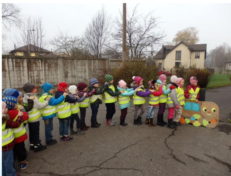
Foto: RCB filiālbibliotēkas "Zemgale" vilcieniņa pirmā pietura ir bibliotēkas pagalmā

Tradicionāli sadarbībā ar bērnudārziem notika daudzveidīgi pasākumi mazuļiem, kuros viņi iepazīna burtu un grāmatu pasauli. Vairākās RCB filiālbibliotēkās bija izveidotas pasākumu programmas, kas paredzēja regulāras nodarbības, piemēram, RCB Bērnu literatūras nodaļā – "Lasīšanas darbnīca" un "Ģimenes bibliotēka", kur bērni kopā ar Runājošo Ābeci skatīja bibliotēkas dārgumu lādi, līdzdarbojās Zaķīša skolā un muzikālajā nodarbībā ar klavieru "iemēģināšanu", piedalījās literārajā ceļojumā, kurā meža dzīvnieki (tika izmantotas dzīvnieku maskas) ar burvju paklāja palīdzību apmeklēja bibliotēkas "Pasaku mežu", "Spēļu pļavu" un "Grāmatu māju". Bet RCB Imantas filiālbibliotēkā mazuļi iepazīna grāmatas, pasauli un lietas "Kāpēcīšu skolā", kas notika 2 reizes nedēļā (kopā 62 nodarbības), un "Grāmatu drauga" 16 nodarbībās.