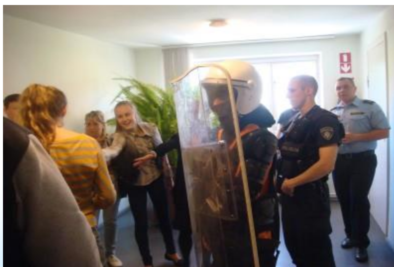
Foto: Policista profesijas iepazīšana, izmēģinot ekipējumu (RCB Bīķernieku filiālbibliotēka)

2014.gadā RCB ir samazinājies lasītāju - pamatskolas skolēnu - skaits. Pusaudži ne reti par iemeslu grāmatu nelasīšanai minējuši brīvā laika trūkumu – aizņemtību skolā, piedalīšanos ārpuskolas nodarbībās. Pilsētā krasi palielinājies to iestāžu skaits, kas piedāvā kvalitatīvas ārpuskolas nodarbības - 34 bērnu un jauniešu centri (13 pašvaldības), 9 mūzikas un mākslas skolas, daudzi brīvā laika interešu centri, vairākas deju skolas, sporta centri u.c., realizēti 18 apjomīgi pašvaldības projekti bērnu līdzdalībai bezmaksas aktivitātēs, organizētas 200 nometnes utt. Šajā lielajā aktivitāšu piedāvājumā iekļāvās arī RCB un tās filiālbibliotēku pasākumu klāsts.