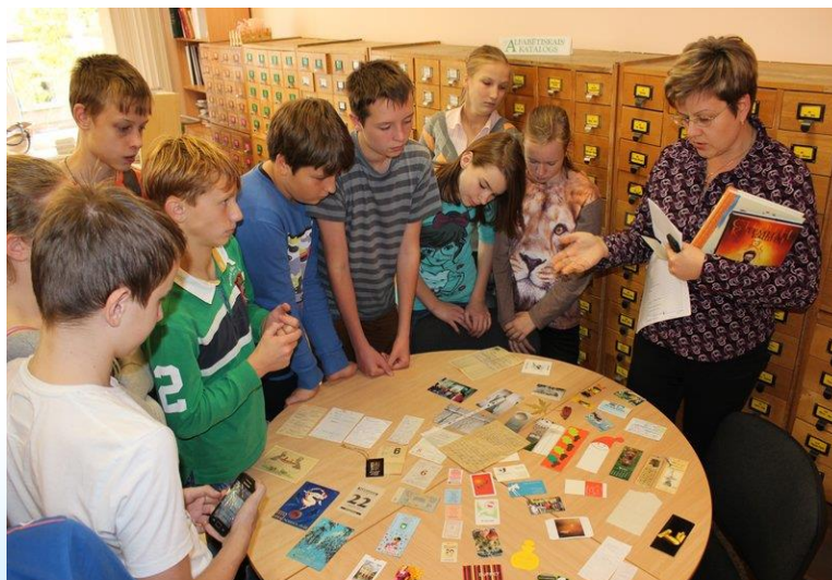
Foto: RCB filiālbibliotēkas "Zemgale" lasītāji iepazīst RCB Komplektēšanas un apstrādes nodaļas darbu

Pusaudži labi orientējas tehnoloģijās, ir prasmīgi to lietotāji, tomēr ne reti viņiem trūkst informācijas par uzziņu resursu daudzveidību. Modernās tehnoloģijas mūsdienīgā bibliotēkā pusaudži iepazīna RCB Imantas, Sarkandaugavas filiālbibliotēkās, filiālbibliotēkā "Strazds" u.c. Populāras bija bibliotekārās stundas – diskusijas par bibliotēku nākotnes perspektīvām (RCB Imantas filiālbibliotēka), pasaules skaistākajām bibliotēkām un bibliotekāra tēlu (RCB Juglas filiālbibliotēka). Raksturīga ir tendence - pusaudži arvien aktīvāk iesaistās "Ēnu dienā", vēlas iepazīt un izmēģināt bibliotekāra profesijas ikdienu. Nedēļas garumā bērni mācījās un veica grāmatu kārtošanu plauktos, bērnu nodaļas lasītāju konsultēšanu, materiālu atlasīšanu, literatūras izstāžu veidošanu RCB filiālbibliotēkā "Avots", bet "ēnotāji" RCB Torņakalna, Sarkandaugavas filiālbibliotēkās praktizējās bibliotekārās apkalpošanas darbā - grāmatu meklēšanā, izsniegšanā, pieņemšanā un dažādu uzdevumu veikšanā.