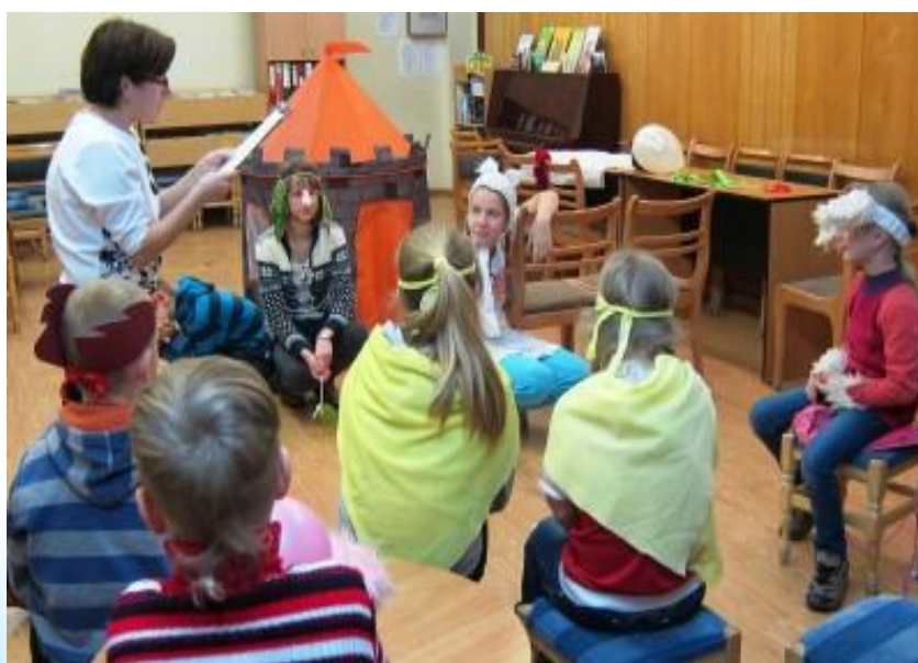
Foto: Izrādes iestudēšanas process RCB Sarkandaugavas filiālbibliotēkā

Radošās nodarbības dažās filiālēs bija populāras un notika regulāri (RCB ārējais apkalpošanas punkts "Saulaino dienu bibliotēka" BKUS, RCB filiālbibliotēka "Vidzeme", RCB Bērnu literatūras nodaļa, RCB Ķengaraga filiālbibliotēka), citās – tie bija atsevišķi pasākumi.