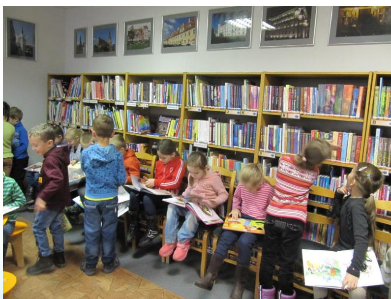
Foto: Mazākie bērni iepazīst RCB Bišumuižas filiālbibliotēku

Pirmsskolas vecuma bērni ekskursijās iepazīna RCB filiālbibliotēku grāmatu daudzveidību, piedalījās spēles un viktorīnās, uzzināja, kā kļūt par lasītāju un kā jāuzvedas bibliotēkā, tikās ar grāmatas veidotājiem. Jautrie, rotaļīgie pasākumi mazuļiem patīk, piemēram, RCB Ķengaraga filiālbibliotēkā bibliotēkas iepazīšana kopā ar Pepiju, Mašu u.c. tēliem, RCB Grīziņkalna filiālbibliotēkā neparastas formas grāmatu skatīšana, RCB Sarkandaugavas filiālbibliotēkā "jautrā lasīšana" un teksta satura izspēlēšana ar rotaļlietām, kas mijās ar draudzības spēlēm un garšīgo rokdarbu veidošanu (lidmašīnas no vafelēm, konfektēm, baranciņām). Bibliotekāro stundu elementi parasti papildināja daudzus tematiskos pasākumus, kas mazākajiem bērniem notika visās RCB filiālbibliotēkās (skat. nodaļu "Pasākumi pirmsskolas vecuma bērniem un vecākiem").