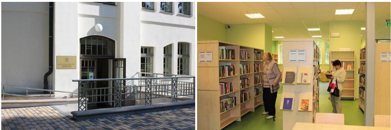
RCB Ziemeļblāzmas filiālbibliotēka atjaunotajā kultūras pilī

RCB tīkla attīstības, bibliotēku iekārtošanas un pakalpojumu pieejamības un to popularizēšanas jomā nozīmīga bija RCB Ziemeļblāzmas filiālbibliotēkas atvēršana jaunās telpās atjaunotajā kultūras pilī „Ziemeļblāzma” septembrī. Rīdzinieku informēšanai par bibliotēkas sniegtajiem pakalpojumiem, bibliotēkas esošo lasītāju uzrunāšanai un jaunu lasītāju piesaistīšanai – šim nolūkam tika izstrādāti un sagatavoti dažādi publicitātes materiāli: buklets, informatīvas lapiņas, plakāti u.c.