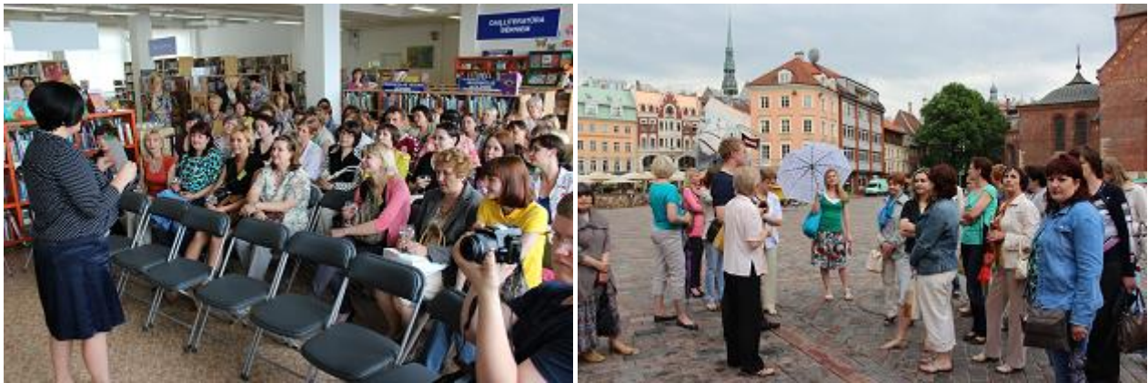
Zarasu un Latgales Centrālās bibliotēkas kolēģi apmeklēja bibliotēku un piedalījās ekskursijā pa Vecrīgu

31. maijā RCB apmeklēja starptautiskā semināra „Bērnu lasīšanas īpatnības un tendences Latvijā” izbraukuma sesijas dalībnieki no Zarasu municipālās publiskās bibliotēkas (Lietuva) un Latgales Centrālās bibliotēkas. Viesi iepazinās ar RCB nodaļu darbu un bibliotēkas informācijas pakalpojumu attīstības tendencēm, kā arī aplūkoja ievērojamākos Vecrīgas kultūrvēsturiskos pieminekļus RCB darbinieku vadītajā ekskursijā „Pirmā pastaiga pa Vecrīgu”.