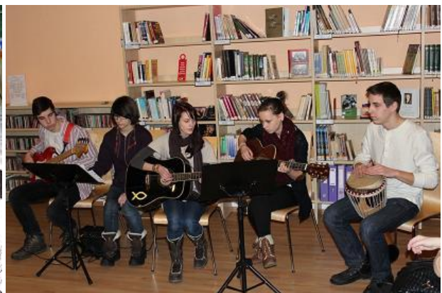
Pasākums jauniešiem (RCB Bērnu literatūras nodaļa)

2013.gadā palielinājies bibliotekāro stundu skaits, kurās bērni un jaunieši iepazīna bibliotēku un tās pakalpojumus, krājumu, datubāzes. Bibliotekārajās stundās pirmsskolas izglītības iestāžu bērni guva priekšstatu par grāmatu daudzveidību, mācījās alfabētu, piedalījās rotaļās. Sākumskolas skolēni iepazīnās ar bibliotēkas lietošanas noteikumiem, izdevumu veidiem, to izvietojumu plauktos (RCB Juglas, Grīziņkalna filiālbibliotēka, filiālbibliotēka „Zvirbulis”), pētīja grāmatu uzbūvi, tikās ar ilustrāciju veidotājiem (RCB Ķengaraga filiālbibliotēka), noskaidroja atšķirības skolas un publiskās bibliotēkas darbā (RCB Mežciema filiālbibliotēka), iepazīna RCB tīmekļa vietni un blogu bērniem (RCB Mežciema filiālbibliotēka, filiālbibliotēkas „Zemgale”, „Vidzeme”). Vidējo un vecāko klašu skolēniem noderīga bija padziļinātu bibliotekāro zināšanu un informācijas