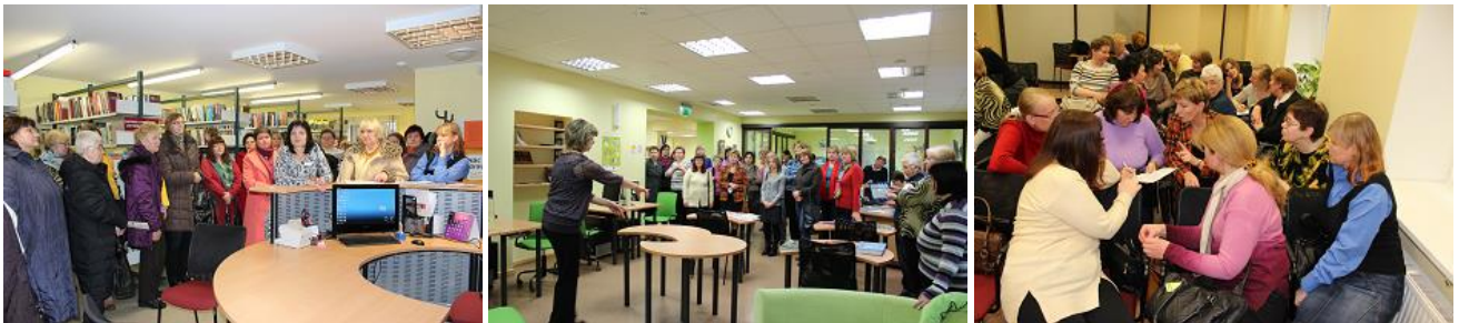
Pieredzes apmaiņa Salaspils novada bibliotēkā un tās Saulkalnes filiālbibliotēkā

Martā-aprīlī 11 RCB jaunajiem bibliotekārajiem darbiniekiem tika organizēts tradicionālais mācību kurss par darba procesu organizēšanu RCB, bibliotēkā darba pamatiem un aktualitātēm. Nodarbības vada RCB Bibliotēku dienesta un Automatizācijas nodaļas speciālisti ar mērķi veidot piederības izjūtu RCB. Pilnu mācību kursu veidoja 34 akadēmiskās stundas un tā beigās ikviens jaunais darbinieks veica pārbaudes testu.