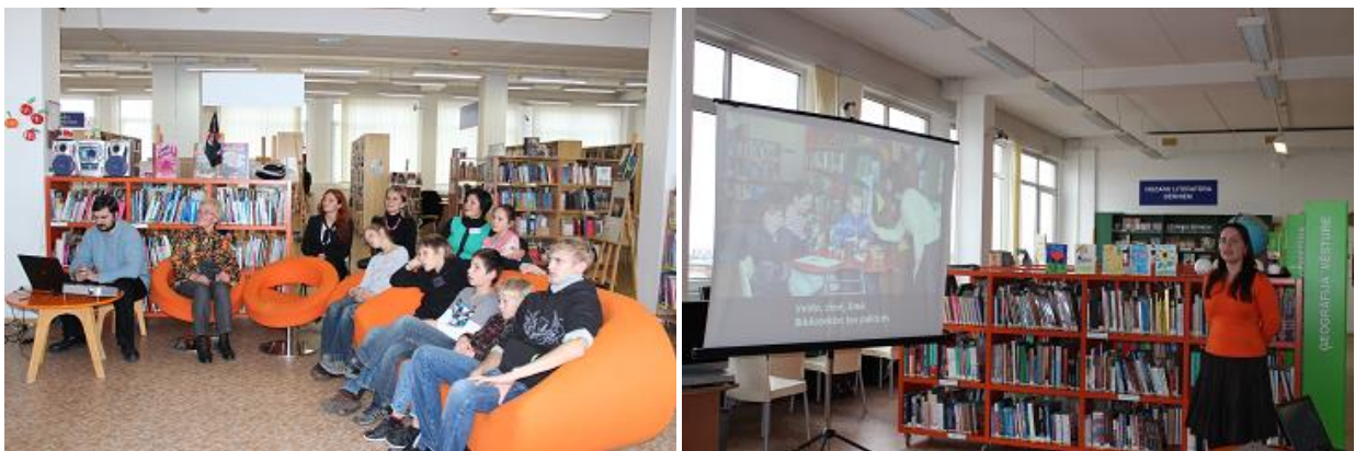
„Ielūgums uz bibliotēku” prezentācija

Projekta ietvaros vieglajā valodā tika adaptēts RCB lietošanas noteikumu teksts, lai atvieglotu to uztveri bērniem un pusaudžiem ar īpašām vajadzībām. Tulkojums palīdzēs vieglāk saprast un produktīvāk lietot bibliotēkas piedāvātos pakalpojumus. Lietošanas noteikumi vieglajā valodā drukātā veidā pieejami visās RCB filiālbibliotēkās, kā arī tie tika publicēti RCB tīmekļa vietnē.