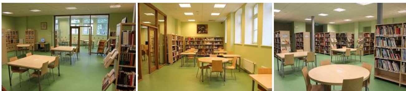
RCB Ziemeļblāzmas filiālbibliotēkas jaunās telpas

2013.gadā par RCB budžeta līdzekļiem tika veikti nelieli telpu uzturēšanas remontdarbi vairākās RCB filiālbibliotēkās.