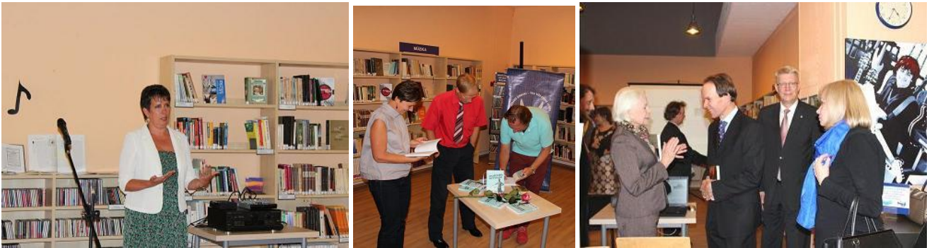
„Jumavas” grāmatu prezentācijas Rīgas Centrālajā bibliotēkā