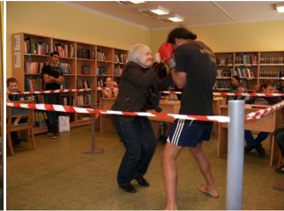
Tikšanās ar jauniešiem sportistiem - kikbokss (RCB filiālbibliotēka "Zemgale")

2013.gadā RCB intensīvāks bijis darbs ar interešu grupām – gandrīz visās filiālēs tika organizētas regulāras vai atsevišķas nodarbības, aicinot tajās piedalīties visus interesentus, palielinājies lasītāju klubiņu skaits. Parasti pasākumu visiem interesentiem norises laiks ir skolas brīvlaiki, sestdienas, darbdienu pēcpusdienas, kad bērni beiguši mācības skolā. Bērni labprāt bibliotēkā iesaistījās radošo nodarbību aktivitātēs, lugu iestudējumos, akcijās, viktorīnās, koncertos, izstāžu veidošanā u.c.