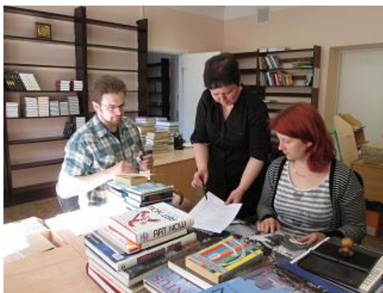
Praktikanti RCB Komplektēšanas un apstrādes nodaļā

Pārrobežu sadarbība (skat. arī pārskata sadaļu „Projektizstrāde” un „Kopdarbība ar pašvaldības un citām institūcijām. Publicitāte”)