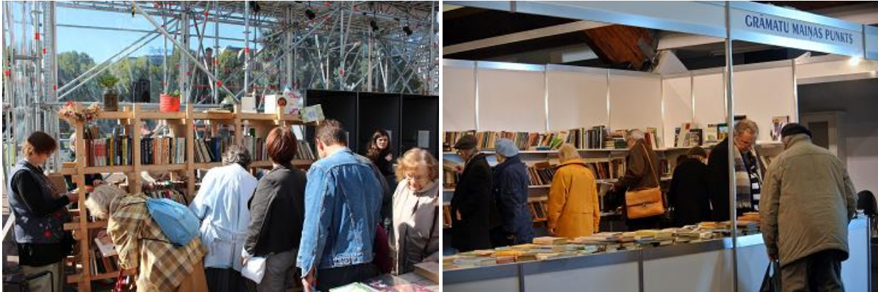
Grāmatu maiņas punkti

levērojams darbs RCB Repozitārija Apmaiņas fondā veikts ar informācijas resursiem, kuri nodoti novadu bibliotēkām, skolām un citiem sadarbības partneriem. 60 iestādes un organizācijas kā bezmaksas dāvinājumus saņēmušas 17 119 eksemplārus, no kuriem 10 146 nodoti Latvijas novadu bibliotēkām, 2 521 – izglītības iestādēm, bet 3 683 eksemplāri nodoti grāmatu maiņas punktiem. 2013.gadā RCB ar grāmatām piedalījās 6 grāmatu maiņas punktos. 769 grāmatas nodotas citām institūcijām.