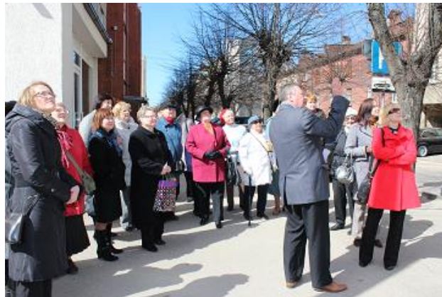
Pastaiga pa Grīziņkalnu

RCB Imantas filiālbibliotēkā izstrādāts jauns digitāls ceļojums „Sudrabkalniņš”, kas iekļauts bibliotēkas sagatavotajā ceļojumu ciklā „Īss ieskats Pārdaugavas vēsturē”.