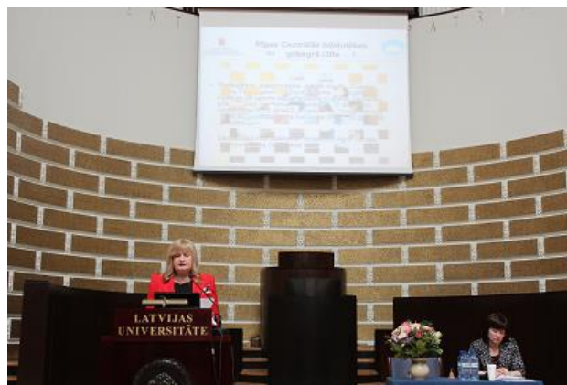
Intas Sallinenes prezentācija LBB konferencē

Pārskata gadā turpinājās RCB sadarbība bibliotēku novadpētniecībā ar Latvijas Bibliotekāru biedrību (LBB), LNB Mācību centru un Talsu Galveno bibliotēku.