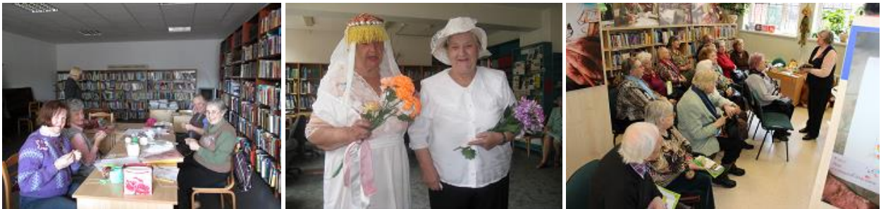
Lasītāju klubu pasākumi Bišumuižas, Torņakalna un Grīziņkalna filiālbibliotēkā

2013.gadā RCB ir palielinājies lasītāju klubu skaits. Bibliotēkās cilvēki pulcējās, lai iepazītos ar interesantām personām, kopā izklaidētos, priecātos, atklātu savus talantus, apgūtu jaunas prasmes. Sarunas par literatūru, grāmatām, rakstniekiem pulcēja lasītājus klubos: „Dzejas mīļotāji” RCB Ķengaraga un Pļavnieku filiālbibliotēkā; „Literāri – muzikālais klubs” RCB Imantas filiālbibliotēkā; „Lasītprīeks” RCB filiālbibliotēkā „Zemgale”; „Kodols” un „Sarunas par dzīvi, kultūru un vidi” RCB filiālbibliotēkā „Vidzeme”.