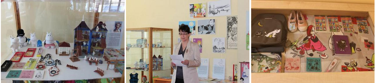
Izstādi „Muminu ģimene un Somija” filiālbibliotēkā „Vidzeme” un „Saulaino dienu bibliotēkā” atklāja Somijas vēstniece Latvijā Pirkko Hamalainena