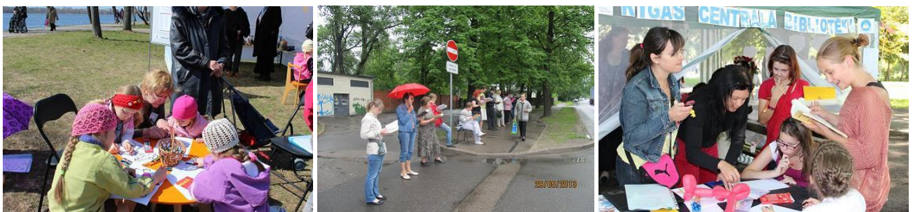
Rīgas Centrālā bibliotēka iziet ielās: 4.maija ģimeņu pasākums Daugavas promenādē, KAN darbinieki Lasīšanas dienas zibakcijā un „Nāc un piedalies” Vērmanes dārzā