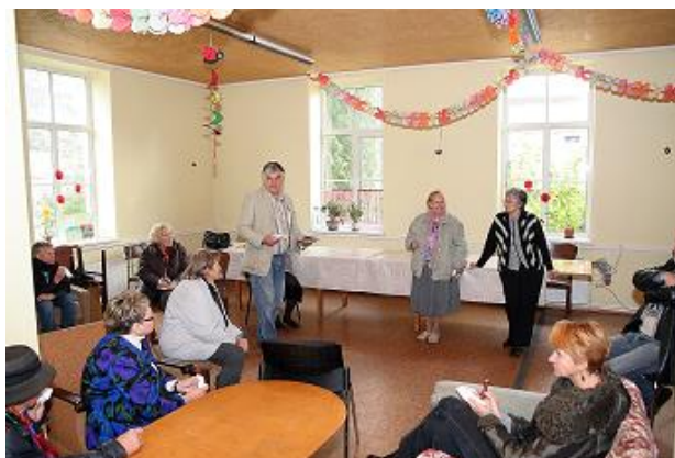
Bišumuižnieki tiekas Bišumuižā

RCB Bišumuižas filiālbibliotēka savā pārskatā norādījusi arī gada veiksmes stāstu, kas noticis tieši novadpētniecības darbā.