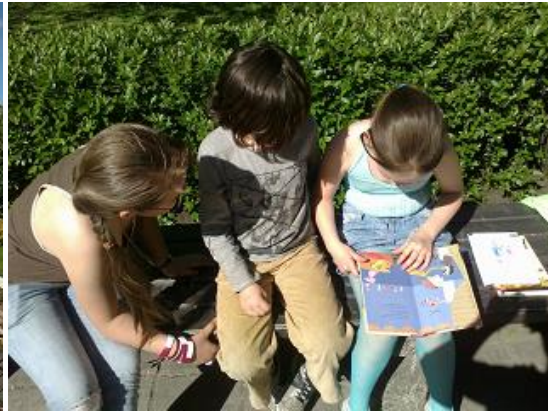
Lasīšanas pasākums parkā (RCB Bērnu literatūras nodaļa)

Nozīmīga ir vairāku RCB filiālbibliotēku sadarbība ar speciālajām skolām, speciālajām pirmsskolas izglītības iestādēm, dienas rehabilitācijas centriem, kuros uzturas bērni ar īpašām vajadzībām. Ticis gādāts gan par izdevumu pieejamību - grāmatu apmaiņa 2 reizes mēnesī dienas centrā bērniem ar kustību traucējumiem (RCB Čiekurkalna filiālbibliotēka), gan par lasītprasmes apgūšanu un lasīšanas veicināšanu bērniem ar attīstības traucējumiem – tematiski pasākumi, bibliotekārās stundas (RCB Daugavas, Iļģuciema, Juglas, Ķengaraga filiālbibliotēka un filiālbibliotēka „Rēzna”), gan par labu noskaņojumu un prieku, vadot radošas nodarbības, kopā rotaļājoties un spēlējot spēles, tiekoties interesantiem cilvēkiem (RCB Ķengaraga, Sarkandaugavas filiālbibliotēka). Speciālo dienas centru apmeklētāji filiālbibliotēkās klausījās koncertus (RCB filiālbibliotēka „Rēzna”, „Zvirbulis” u.c.), veidoja darbus izstādēm (RCB Iļģuciema filiālbibliotēka un filiālbibliotēka „Strazds”), piedalījās viktorīnās (RCB Čiekurkalna filiālbibliotēka).