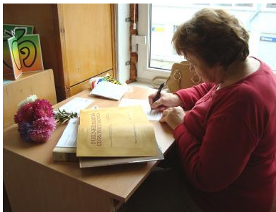
Daugavas filiālbibliotēkā top ieraksts „Tautas grāmatu plaukta” grāmatā

RCB atbalstīja LNB rīkoto akciju „Tautas grāmatu plaukts”.