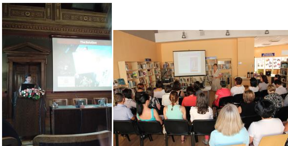
Doloresa Veilande Pecha Kucha sesijā un seminārā Moldovas kolēģiem

27.septembrī Varšavā (Polija) bibliotēkā Mediateka START-META tika atklāta RCB izstāde „Diena kopā ar bibliotekāru”.