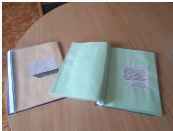
„Rokrakstu mape” Juglas filiālbibliotēkā

Joprojām diskutabls ir jautājums par novadpētniecības mapju izveidē ieguldītā lielā darba apjoma neatbilstību šobrīd mazajai bibliotēkas apmeklētāju interesei par tām.