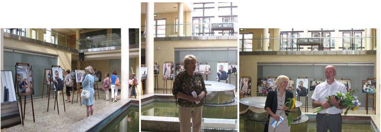
Fotoizstādes „Diena kopā ar bibliotekāru” atklāšana Rātsnamā

Nozīmīgs notikums RCB publicitātes jomā bija fotoizstādes „Diena kopā ar bibliotekāru” tapšana. Fotogrāfiju autors ir fotomākslinieks Imants Urtāns. Izstādē redzami portreti ir mākslinieka atbilde uz jautājumu, kāds ir 21. gadsimta bibliotekārs. Šodien viņš ir gan informācijas speciālists, gan, tāpat kā senāk, cilvēks, ar kuru var parunāt par lasīšanu.