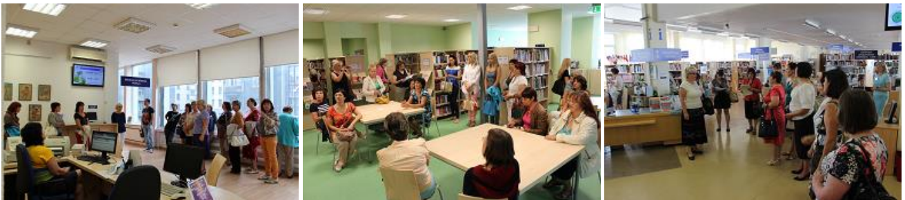
RCB viesi no Talsiem, Ventspils un Moldovas

29.augustā RCB un Ziemeļblāzmas filiālbibliotēku apmeklēja kolēģi no Ventspils pilsētas un novada bibliotēkām.