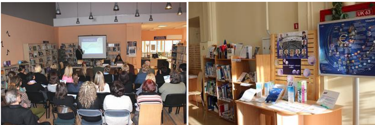
ESIP aktivitātes Rīgas Centrālajā bibliotēkā

RCB Pieaugušo literatūras nodaļā darbojas Eiropas Savienības informācijas punkts (ESIP). 2013.gadā liela uzmanība tika pievērsta galvenajam notikumam Latvijas dzīvē – pievienošanās eiro zonai. Stendā „EIROinfo” apmeklētājiem tika piedāvāti dažādi informatīvi materiāli, kā arī rīkots seminārs (vairāk skat. pārskata sadaļā „Kopdarbība ar pašvaldības un citām institūcijām. Publicitāte”).