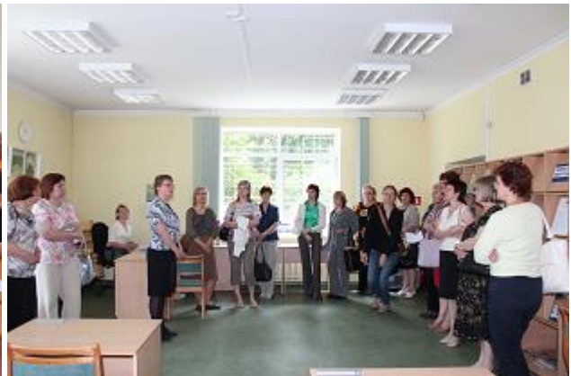
Reģionu galveno bibliotēku metodiķu seminārs