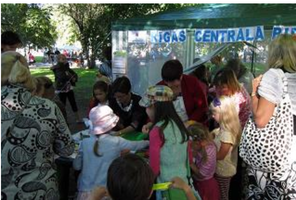
RCB radošo nodarbību telts Vērmanes dārzā

Izvērtējot pasākumu kopumu bērniem un jauniešiem, jāsecina, ka tas ir bijis ļoti intensīvs – RCB organizēti 1855 pasākumi, no tiem bērniem – 1281 (69% no kopskaita). Vairāki pasākumi organizēti nacionālo un starptautisko lasīšanas veicināšanas programmu ietvaros - „Bērnu, jauniešu un vecāku žūrija 2013” (RCB Bērnu literatūras nodaļa un 20 filiālbibliotēkas), „Ziemeļvalstu bibliotēku nedēļa” (RCB Bērnu literatūras nodaļa un 15 filiālbibliotēkas); projektos – „Pasaule t@vā bibliotēkā – UNESCO Pasaules mantojuma izziņāšana”, „Radošais pasākums par drošību Internetā manā bibliotēkā - 2013”, „E-prasmju nedēļa Latvijā”; akcijā „Tautas grāmatu plaukts” u.c.