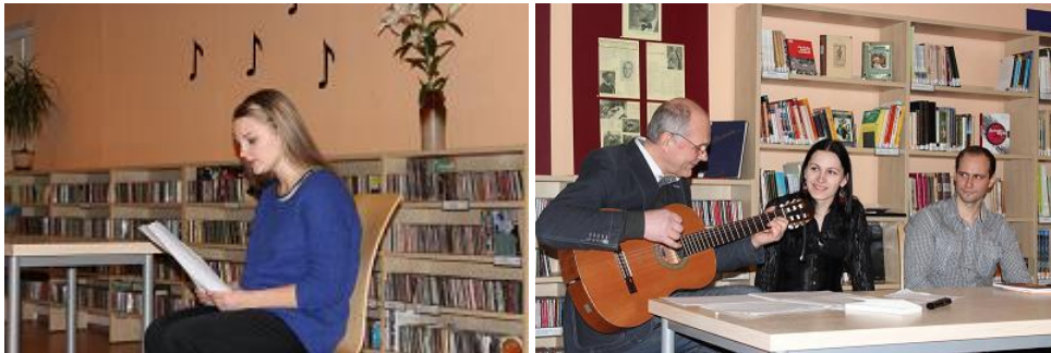
„Dodam vārdu jaunajiem” dalībnieki un viesi Rīgas Centrālajā bibliotēkā