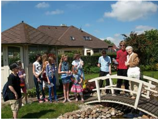
RCB filiālbibliotēkas "Zemgale" lasītāju klubiņš iepazīst apkaimi

Ķengaraga, Mežciema, Sarkandaugavas filiālbibliotēka, filiālbibliotēka „Zemgale”, RCB ārējais apkalpošanas punkts „Saulaino dienu bibliotēka” BKUS u.c.).