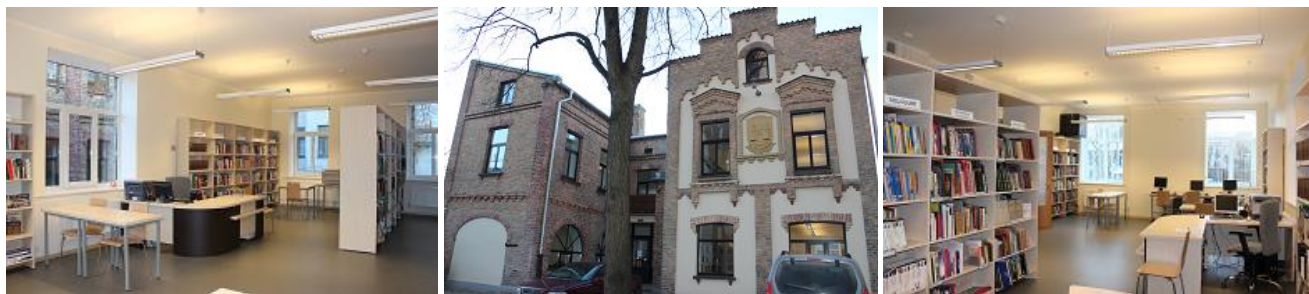
RCB filiālbibliotēka „Avots” pēc renovācijas

RD Īpašuma departaments veicis renovācijas darbus RCB filiālbibliotēkā „Avots”, kā arī pēc kultūras pils „Ziemeļblāzma” renovācijas jaunās telpās tika atvērta RCB Ziemeļblāzmas filiālbibliotēka.