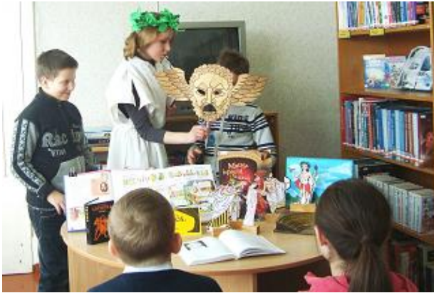
Antīkais teātris RCB Daugavas filiālbibliotēkā

meklēšanas prasmju apgūšana, iepazīstot nozīmīgākās datubāzes (RCB Grīziņkalna, Imantas, Iļģuciema, Mežciema filiālbibliotēka un filiālbibliotēka „Zemgale”).