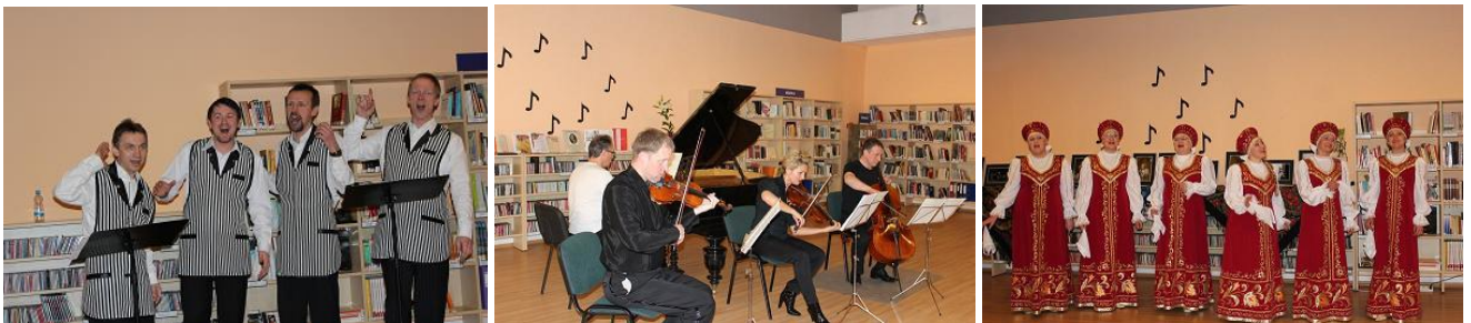
Muzikālie pasākumi RCB Mākslas un mūzikas nodaļā