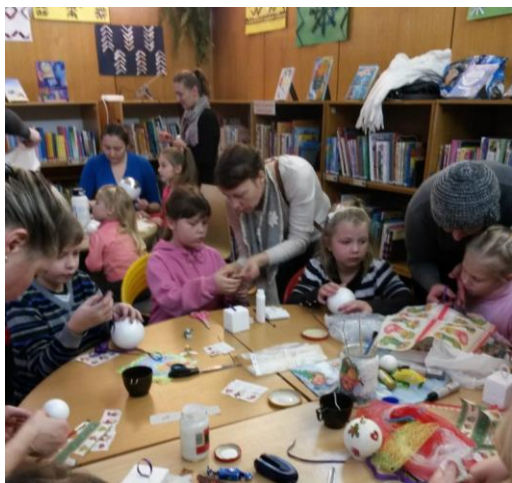
Foto: Radoša ģimeņu darbošanās Kengaraga filiālbibliotēkā