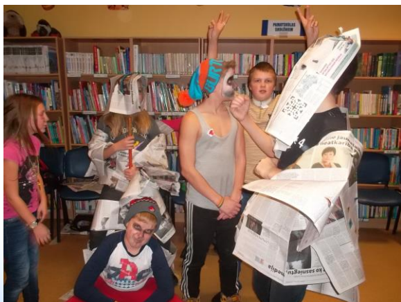
Foto: Jaunciema filiālbibliotēkas lasītāju klubiņa bērni atzīmē Helovīna dienu

Sarkandaugavas filiālbibliotēkā bērni un pusaudži ierosināja pasākumu tematiku, viņiem tika uzticēta arī dažu pasākumu sagatavošana un novadīšana - modes skate ar konkursiem, vaļasprieku aktivitātes, piemēram, "Krāsaino gumiju rokdarbi" (radošā darbnīca, sacensības pīšanas ātrumā, kustību spēles un spēles ar gumijām, radīto darbu izstāde, apbalvošana), konkurss "Lego" faniem "Spēlē, spēlē, ko tu spēlē?" (galda spēļu turnīrs).