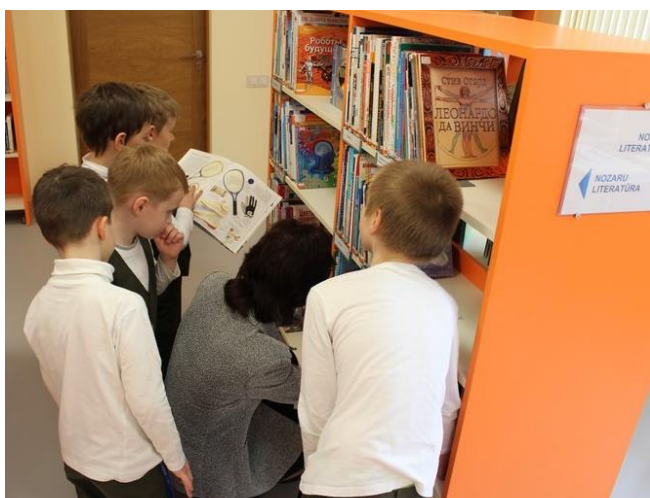
Foto: Enciklopēdiju iepazīšana Daugavas filiālbibliotēkā