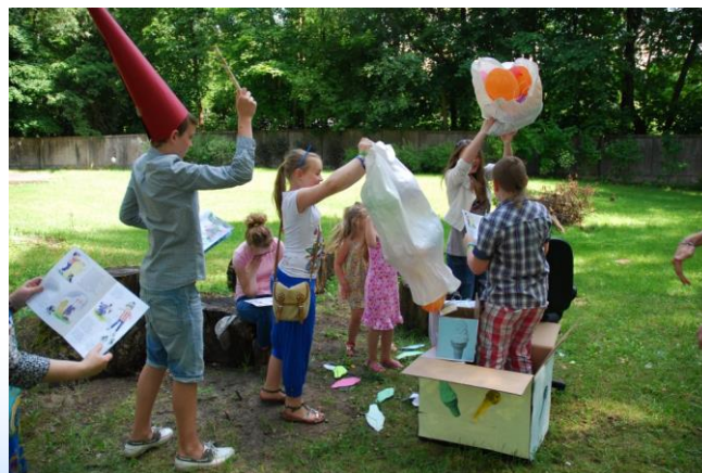
Foto: Grāmatas lasījums lomās filiālbibliotēkas "Zemgale" pagalmā