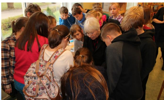
Foto: Skolēni iepazīst bibliotekāra profesiju filiālbibliotēkā "Zemgale"