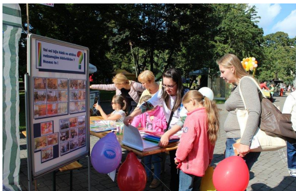
Foto: RCB telts bērnu svētkos

Rīgas Interesešu centra organizētie svētki bērniem Vērmanes dārzā "Nāc un piedalies" ir viens no lielākajiem un jaukākajiem pasākumiem Rīgā. Nozīmīgajam un ļoti kupli apmeklētajam pasākumam RCB bibliotekāru komanda no dažādām filiālēm arvien rūpīgi gatavojas (RCB Bērnu literatūras nodaļa, Imantas, Sarkandaugavas filiālbibliotēkas, filiālbibliotēka "Rēzna"). Svētku laikā RCB informatīvajā un radošo darbnīcu teltī bija iegūstama visplašākā informācija par bibliotēku, tās pakalpojumiem, bet bērniem jautrību un interesi rosināja dalība aktivitātēs: kolāžu veidošana par pasaku tēliem, ātrlasīšanas un burbuļu pūšanas sacensības, dzejoļu veidošana, aizpildot tekstā tukšās vietas, darba lapu aizpildīšana, kurās jāmeklē grāmatu tēlu pazudušās lietas. Bija arī jāiesaka tētim grāmata lasīšanai, jo pirmo gadu svētku laikā notika aktivitātes Tēvu dienas ietvaros. Katrs dalībnieks saņēma balvas - balonu ar RCB apdruku kopā ar vēstuli no kāda grāmatu varoņa (Pepijas, Karlsona, Grega, Pītera Pena), informatīvu bukletu ar aicinājumu apmeklēt bibliotēku un saldumus.