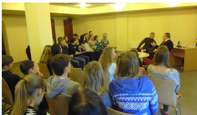
Foto: Tikšanās ar Latvijas džudo federācijas pārstāvjiem Imantas filiālbibliotēkā