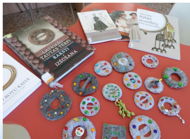
Foto: Saktu veidošanas darbnīcas veikums RCB Bērnu literatūras nodaļā