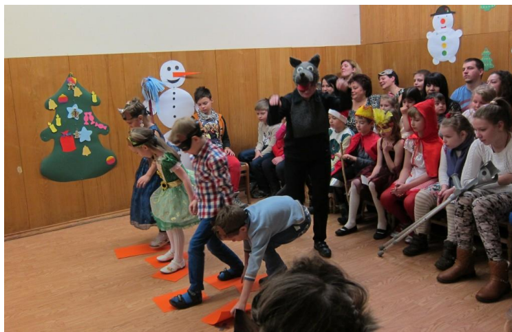
Foto: Pasākums ģimenei Sarkandaugavas filiālbibliotēkā