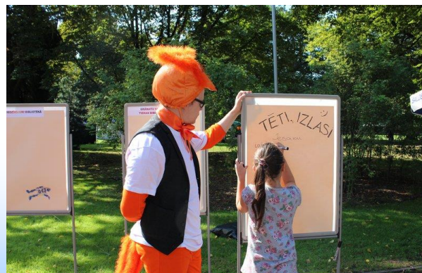
Foto: Tiek ieteikta grāmata tētim