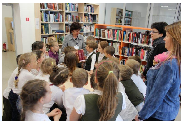
Foto: Skolēni iepazīst Daugavas filiālbibliotēkas grāmatas