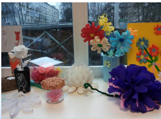
Foto: Ziedus bērni veidoja Jaunciema filiālbibliotēkā

Jaunciema filiālbibliotēkā radošo darbnīcu tēma bija saskaņota ar bērnu klubiņa tikšanās nodarbību tēmu (pasaku varoņu, sniegavīru, ziedu, kaķu veidošana, zīmēšana, izkrāsošana). RCB Bērnu literatūras nodaļā tapa mākslinieciski darbi – saktas/piespraudes, pūces no baltām mežģīņu salvetēm un filca, origami tulpes u.c. Rakstīšanas iemaņas bērni pilnveidoja Imantas filiālbibliotēkā - stāstu konkursā "Notikums bibliotēkā", akcijā "Rakstām kopīgu stāstu") un arī filiālbibliotēkā "Pārdaugava", veidojot dzejojumus (skat. http://bibliotekaberniem.rcb.lv/ "Raksta bērni").