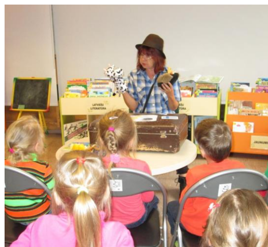
Foto: Ziemeļvalstu bibliotēku nedēļas pasākums Šampētera filiālbibliotēkā