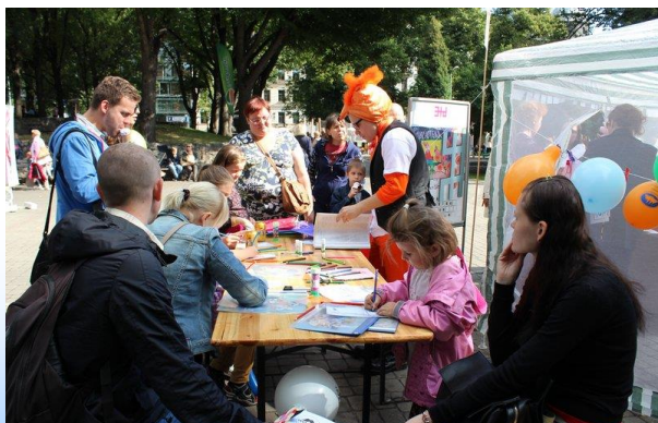
Foto: Radoša darbošanās bērnu svētkos