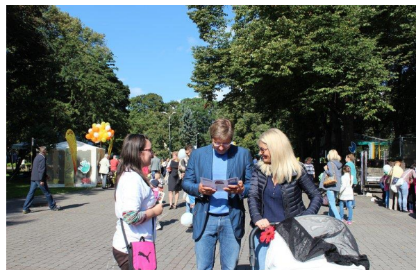
Foto: Bibliotēkas piedāvājumu iepazīst Rīgas mērs N.Ušakovs ar ģimeni