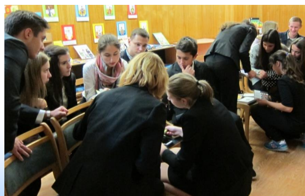
Foto: Skolēni iepazīst bibliotekāra profesiju Sarkandaugavas filiālbibliotēkā