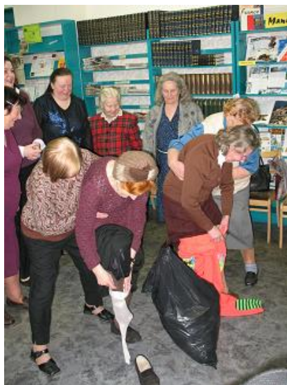
1.aprīļa pasākums kluba „Saulspuķe” dalībniekiem RCB Torņakalna filiālbibliotēkā

Labdarības pasākumus patversmē bezpajumtniekiem organizēja RCB Ķengaraga filiālbibliotēkas darbinieki – koncerts Mātes dienai (ģimeņu nodaļā) un Ziemassvētku sarīkojums, bet RCB Daugavas filiālbibliotēka dāvināja grāmatas nakts patversmei, rehabilitācijas centram "Zilais Krusts" un organizācijai „Pestīšanas armija”. Daudzveidīgs bibliotēkas pakalpojumu klāsts RCB bija pieejams gados vecākiem cilvēkiem – pārrunas par sociālo sistēmu Latvijā (RCB Daugavas filiālbibliotēka); dāmu rokdarbu izstādes (RCB Ķengaraga filiālbibliotēka, filiālbibliotēka "Zemgale" u.c.). Vairāki lasītāji ar nepacietību gaida interesantās tikšanās lasītāju klubos : senioru klubs „Sarma” - grāmatu apskati un pārrunas (RCB Pļavnieku filiālbibliotēka); senioru klubs „Saulīte” – pasākumi par Latvijas vēsturi, pasākumi izklaidei (RCB Grīziņkalna filiālbibliotēka); klubs "Saulspuķe" – atraktīvi, jautri pasākumi (RCB Torņakalna filiālbibliotēka); klubs "Lasītprīeks" – literārie pasākumi, ekskursija uz Doles muzeju ar pikniku (RCB filiālbibliotēka "Zemgale") u.c.