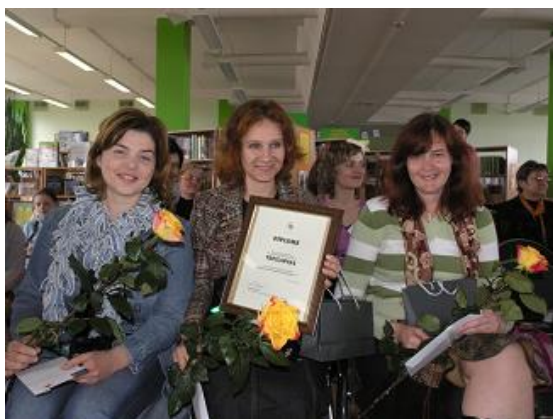
RCB Pļavnieku filiālbibliotēkas komanda

Visās RCB filiālbibliotēkās lietotājiem pieejami bezmaksas interneta pakalpojumi. Uzziņu darbā plaši tiek izmantotas datubāzes: Lursoft, NAIS, Letonika.lv, Nozare.lv, RUBRICON, EBSCO, Likumi.lid.lv, LNB Bibliogrāfijas institūta analītikas datubāze, kā arī dažādas datubāzes CD formātā. Ērtākam uzziņu darbam internetā katrā RCB filiālbibliotēkā blakus lietotāju datoriem ir novietotas speciālas norādes par pieejamajām datubāzēm. Vairākas filiālbibliotēkas piedalījās KIS un Tilde rīkotajā konkursā „Meklē un atrodi datubāzē letonika.lv”. Vislabākos rezultātus filiālbibliotēku vidū uzrādīja RCB Pļavnieku filiālbibliotēkas komanda.