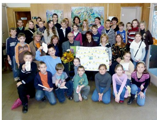
Kopīgs pasākums RCB Ķengaraga, Pļavnieku filiālbibliotēkas un RCB "Rēzna" filiālbibliotēkas lasītājiem

Organizējot pasākumus vecāko klašu skolēniem (jauniešiem) , īpaši svarīgas ir bibliotekāra zināšanas un prasme tematu atklāt interesanti, nozīmīga ir arī uzdrīkstēšanās stāties tik prasīgas auditorijas priekšā. Dažu