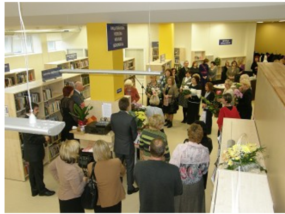
Renovētās RCB Imantas filiālbibliotēkas atklāšana