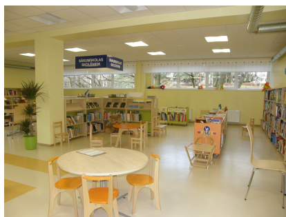
RCB Imantas filiālbibliotēkas bērnu nodaļa

RCB bērni un jaunieši ir viena no prioritārajām lasītāju grupām. RCB un 26 tās filiālbibliotēkās, un ārējā apkalpošanas punktā BKUS kopā ir 22 atsevišķas bērnu nodaļas un papildus tām - 4 atsevišķas telpas mazuļiem, 2 pusaudžiem un 3 spēlēm un rotaļām, bet tajās RCB filiālēs, kurās ir nelielas telpas, ir izdalītas bērnu zonas.