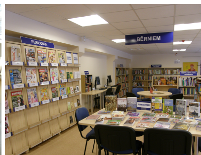
RCB Jaunciema filiālbibliotēkas bērnu nodaļa

Darbā ar bērniem un jauniešiem 2011.gadā RCB īpaši tika akcentēta lasītprieka un radošuma veicināšana: RCB filiālbibliotēku līdzdalība Latvijas un starptautiskajās lasīšanas veicināšanas programmās, pasākumi RCB programmā "Ideju fabrika grāmatā", kuros bērni tika mudināti iepazīt aizraujošo un interesanto grāmatu pasauli.