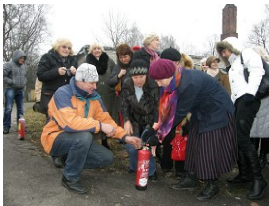
Ugunsdrošības teorētiskā lekcija un praktiskā nodarbība RCB darbiniekiem