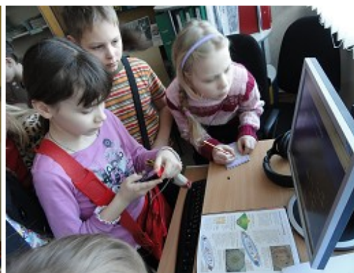
E-prasmju nedēļa RCB Ķengaraga filiālbibliotēkā