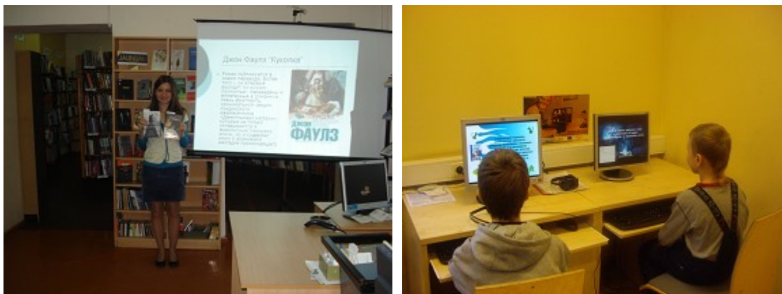
Jaunieguvumu prezentācija RCB filiālbibliotēkā „Rēzna” un prezentācija bērniem RCB filiālbibliotēkā „Vidzeme”

Lai popularizētu jaunieguvumus, tiek organizētas Jauno grāmatu dienas un jaunieguvumu izstādes, kuras papildina jauno grāmatu apskati, bibliogrāfiskie saraksti, kuros atspoguļotas filiālbibliotēkā saņemtās vai konkrētai lasītāju grupai adresētās jaunās grāmatas. Ar jaunieguvumu sarakstiem tiek iepazīstinātas arī citas mikrorajona iestādes (rajona izpilddirekcija, politiski represēto klubs, pansionāti, dienas centri, rehabilitācijas centri) un skolas. Ar jaunieguvumu sarakstiem regulāri tiek iepazīstināti sadarbības partneri. RCB filiālbibliotēkā „Vidzeme” un „Rēzna” informāciju par jaunieguvumiem papildina PowerPoint prezentācijas.