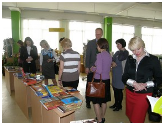
Izstāde „Rīga grāmatās no senatnes līdz mūsdienām” un apgāda „Jumava” 20 gadu jubilejas izstāde