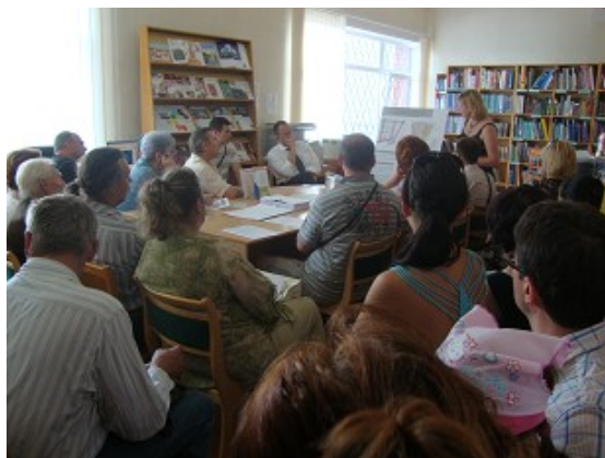
Sabiedriskā apspriešana RCB Pļavnieku filiālbibliotēkā