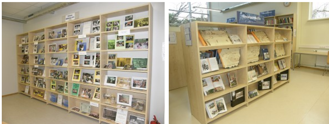
Bibliotēkas vēstures un novadpētniecības materiālu izstāde RCB Imantas filiālbibliotēkā

Izstādes par novadu joprojām ir viena no biežāk izmantotajām darba metodēm novadpētniecības materiālu atklāšanai. Popularitāti guvuši izstāžu cikli, kuri vispusīgi atklāj bibliotēkas apkaimi, iepazīstina ar novadniekiem. Interesi raisa novadnieku radošo darbu izstādes. Tā RCB filiālbibliotēka „Vidzeme” populārs ir izstāžu cikls „Rīga senā un mainīgā”, kurā izstādes mainās, taču tajās visās tiek akcentēta Vidzemes priekšpilsēta.