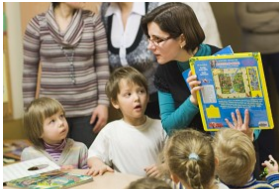
Mazuļi RCB Sarkandaugavas filiālbibliotēkā

Mazuļu grupiņas labprāt devās ekskursijās uz bibliotēku, kur iepazīna aizraujošo grāmatu pasauli (RCB Daugavas, Sarkandaugavas, Ķengaraga, Grīziņkalna filiālbibliotēka un RCB filiālbibliotēka "Rēzna"), bet pie tiem bērnu dārzu bērniem, kuri nevar atnākt uz bibliotēku, devās paši bibliotekāri (RCB Jaunciema, Imantas, Čiekurkalna filiālbibliotēka). Strādājot ar pirmsskolas vecuma bērniem, arvien populārāki kļuvuši priekšā lasīšanas pasākumi, kas tika papildināti ar viktorīnām, radošām aktivitātēm, ludziņu iestudēšanu, pasaku spēlēm (RCB Imantas, Jaunciema, Ķengaraga, Sarkandaugavas filiālbibliotēka).