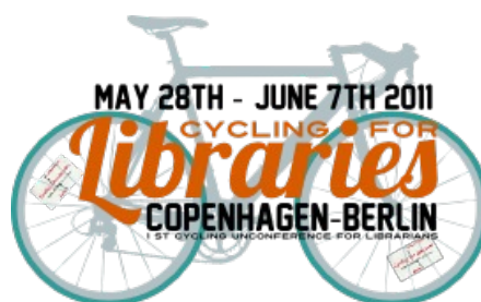
Ilze Marga ne-konferencē „Velobrauciens par bibliotēkām”

2.jūnijā RCB filiālbibliotēkā „Vidzeme” viesojās Tbilisi (Gruzija) mērs Georgijs Ugulava.