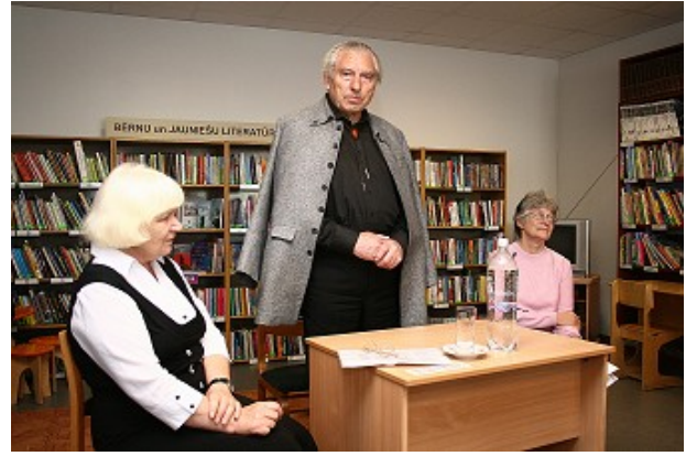
UNESCO Latvijas Nacionālās komisijas projektā “Stāstu bibliotēkas” pasākumi RCB Bišumuižas filiālbibliotēkā