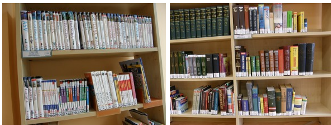
Izdevumu, kuri paredzēti izmantošanai uz vietas bibliotēkā, marķējums

2011.gads iezīmējas ar lielām pārmaiņām krājuma kārtojumā. Lai padarītu lietotājiem pieejamāku krājumu, struktūrvienības lielu daļu informācijas resursu novirzīja izsniegšanai mājās, atstājot lietošanai uz vietas atsevišķus izdevumus ar enciklopēdisku saturu. Daļa RCB struktūrvienību veica arī lasītavas un abonementa daļas apvienošanu. Tādējādi lietotājam tiek dota iespēja pilnībā iepazīties ar visiem informācijas resursiem vienuviet. Lai lietotājiem nerastos pārpratumi, izdevumi, kuri paredzēti izmantošanai uz vietas, tiek marķēti ar speciālu uzlīmi.