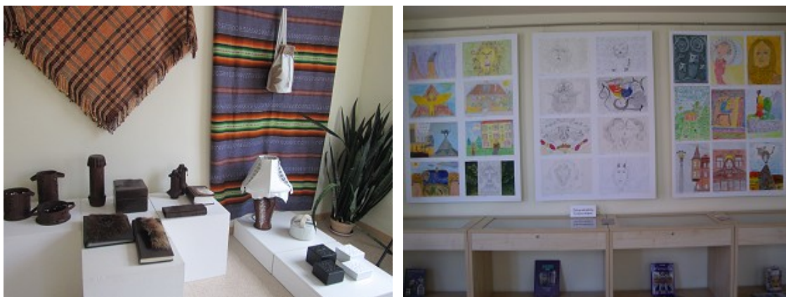
Izstādes RCB filiālbibliotēkā „Vidzeme”

2011. gadā turpinājās darbs pie vienotas formas bukleta veidošanas par RCB un filiālbibliotēku pakalpojumiem. Līdz gada beigām bukleti latviešu un krievu valodā izveidoti visām RCB filiālbibliotēkām. Iespēju robežās tika veidots vienots bibliotēku telpu noformējums : bibliotēku izkārtnes, informācija par darba laikiem, telpu norādes, informācija par pakalpojumiem, plauktu uzraksti, krājuma daļēni u.c. Vienotā stilā veidotais noformējums, pirmkārt, veido RCB kā vienotas iestādes tēlu, otrkārt, palīdz lasītājiem, kas apmeklē vairākas RCB filiālbibliotēkas, labāk orientēties bibliotēkas piedāvājumā. 2011.gadā atvērto RCB filiālbibliotēku telpu norādes un daļa informatīvo uzrakstu RCB finansējuma iespēju robežās tika izgatavotas profesionālās firmās. Dažādu informatīvo norāžu un materiālu noformējumu bibliotēkām veidoja RCB Bibliotēku dienesta noformēšanas māksliniece.