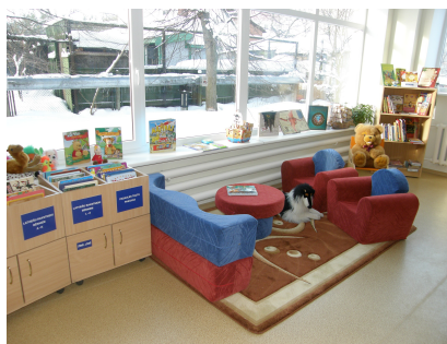
RCB Biķernieku filiālbibliotēkas bērnu zona