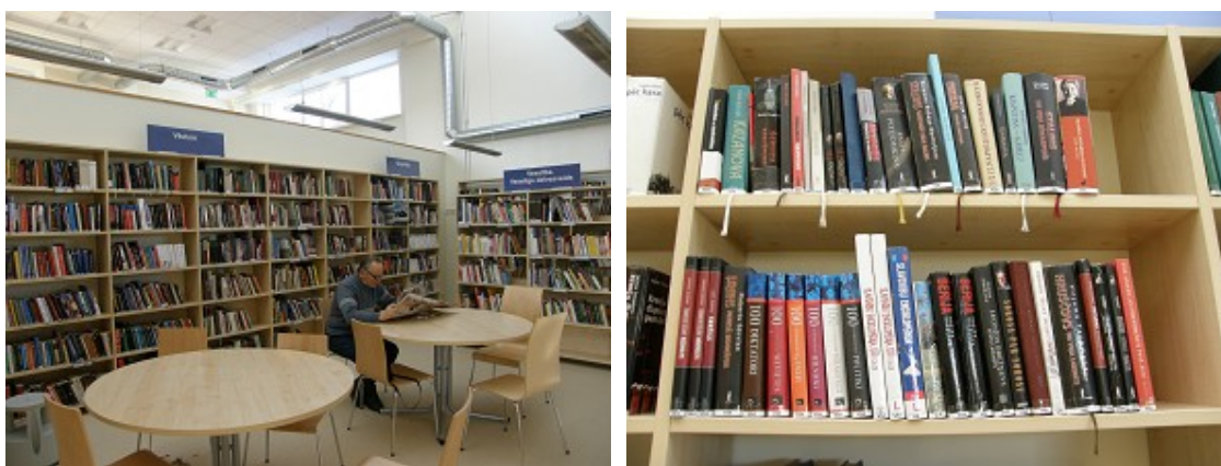
Tematiskais kārtojums un tā marķējums RCB Imantas filiālbibliotēkā

tās apjomīgajam krājumam esošās nodaļas „Vēsture” un „Ģeogrāfija” tika vēl arī paplašinātas. Lai ar aktuāliem informācijas resursiem nodrošinātu un atbalstītu uzņēmējdarbības vidi, šai struktūrvienībai tika izstrādāts jauns temats: „Bizness. Uzņēmējdarbība”. Jauni temati ir arī „Rīgas novadpētniecība” un „Latvijas kultūras vēsture”. Izvērtējot pilotprojektu RCB filiālbibliotēkā „Pārdaugava”, speciālisti konstatēja, ka temats „Darbs. Karjera” nav guvis pietiekami lielu atsaucību tai paredzētās auditorijas – bezdarbnieku – vidū. Interesants tas bija studentiem, kuri pēc šāda veida informācijas resursiem vēršas mācību nolūkos. Tāpēc tika nolemts mainīt šī temata mērķauditoriju un attīstīt tematu, orientējoties vairāk uz darba devējiem. Tādējādi radās jauns temats „Bizness. Uzņēmējdarbība”, kurā apkopotie informācijas resursi nepieciešami arī uzņēmumu vadītājiem (likumdošana, personāla vadība u.c.). Tā kā šajā tematā izdalīta apakšnodaļa arī potenciālajiem darba ņēmējiem, citas RCB struktūrvienības var izvēlēties akcentēt krājuma tematiku atbilstoši savu bibliotēku lietotāju vajadzībām.