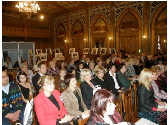
RCB 105 gadu jubilejas konference