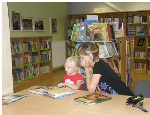
Kopīga grāmatu lasīšana bibliotēkā

Bērniem ar īpašām vajadzībām 2011.gadā organizēti pasākumi, sadarbojoties ar specializētajām mācību iestādēm (skolām), dienas centriem. Dienas aprūpes centra jauniešiem ar garīgās uztveres traucējumiem pasākumus – tematiskas tikšanās, grāmatu apskatus, dzejas pēcpusdienas, krāsaino smilšu darbnīca, tikšanās ar ceļu policijas pārstāvjiem u.c. – organizēja gan RCB Ķengaraga filiālbibliotēkas, gan filiālbibliotēkas "Rēzna" bibliotekāri. Speciālās skolas bērniem notika pasākumi RCB Sarkandaugavas un Daugavas filiālbibliotēkā, organizējot tematiskus pasākumus, radošas aktivitātes (krāsošana, līmēšana, origami), tautas dziesmas un rotaļas, svētku koncertu, teatralizētu uzvedumu ar uzdevumiem skatītājiem. Bet grāmatu nomaiņu reizi 2 nedēļās bērniem ar kustību traucējumiem rehabilitācijas centrā "Mēs esam līdzās" organizēja RCB Čiekurkalna filiālbibliotēkas bibliotekāri. Atsevišķus pasākumus – radošo darbu izstādes, tematiskas tikšanās, ekskursijas uz bibliotēku – speciālo mācību iestāžu bērniem organizējuši arī RCB Juglas, Torņakalna filiālbibliotēka un RCB filiālbibliotēkas "Zvirbulis", "Vidzeme", "Strazds" bibliotekāri.