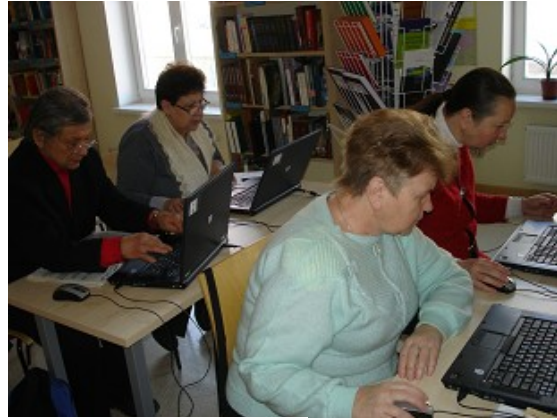
"Cepuru balle" RCB Grīziņkalna filiālbibliotēkā un datorprasmju apgūšanas nodarbība RCB filiālbibliotēkā "Vidzeme"

Bezdarbnieku skaits 2011.gadā nav mazinājies. Ņemot vērā to, ka šīs grupas lietotāju pieprasījumi saistās ar darba meklējumiem, visās RCB filiālbibliotēkās bibliotekāri sniedza konsultācijas un veica apmācības par darba meklēšanas iespējām internetā. Par RCB filiālbibliotēku pakalpojumiem tika informēti sociālie darbinieki - RD Labklājības departamenta rīkotā semināra dalībnieki. Semināra laikā izplatīšanai tika nodoti RCB informatīvie materiāli: buklets "Bezdarbs≠bezdarbība", tematiskais saraksts "Darba meklētājiem", kas sagatavots RCB Jaunciema filiālbibliotēkā, RCB filiālbibliotēku adresu saraksts.