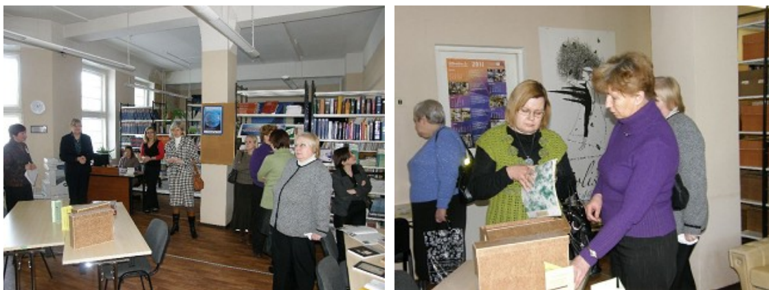
RCB darbinieki seminārā LNB Bibliotēku attīstības institūtā