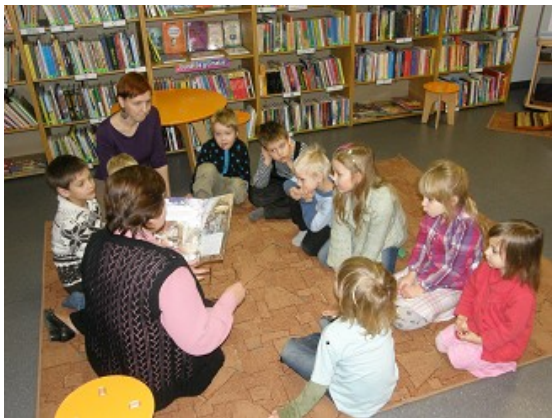
Pasākums RCB Bišumuižas filiālbibliotēkā

Regulāras attīstošas un izglītojošas nodarbības mazuļiem organizējušas gandrīz visas RCB filiālbibliotēkas, pārsvarā tās bijušas tematiskas nodarbības sadarbībā ar pirmsskolas mācību iestādēm.