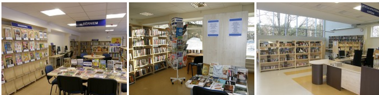
2011.gadā tika atklāta jaunā RCB Biķernieku filiālbibliotēka un renovētā Jaunciema un Imantas filiālbibliotēka

Lai uzsāktu reorganizāciju, jūlija beigās lasītājiem tika slēgta RCB Svešvalodu filiālbibliotēka un RCB Mākslas un mūzikas filiālbibliotēka „Tilts”. Kopš 15.augusta sakarā ar telpu paplašināšanu un divu specializēto filiālbibliotēku pievienošanu slēgta RCB galvenā bibliotēka Brīvības ielā 49/53. Tās atvēršana lasītājiem notiks 2012.gada 16.februārī.