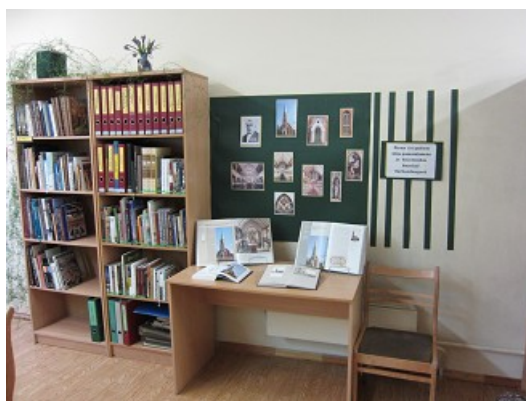
RCB Sarkandaugavas filiālbibliotēkas novadpētniecības materiālu krājums

Reorganizētās RCB Mākslas un mūzikas filiālbibliotēkas „Tilts” novadpētniecības krājums ir pārskatīts, iesākts darbs pie RCB „Rīgas istabas” izveides jaunajās RCB Mākslas un mūzikas nodaļas telpās.