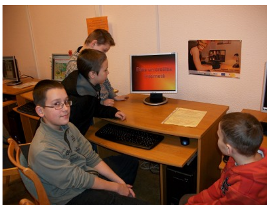
Droša interneta stunda RCB filiālbibliotēkā "Zemgale"

2011.gadā rīkotajos pasākumos tika aicināti piedalīties visi interesenti: ekskursijas Rīgā un Latvijā (RCB Sarkandaugavas, Bolderājas filiālbibliotēka un RCB filiālbibliotēkas "Rēzna", "Strazds"), tikšanās ar rakstniekiem un interesantām personām (RCB Ķengaraga, Pļavnieku, Sarkandaugavas filiālbibliotēka un RCB filiālbibliotēka "Rēzna", "Zvirbulis"); pasākumi meitenēm (RCB Bišumuižas filiālbibliotēka un RCB Bērnu literatūras nodaļa), vides pulciņu regulārās nodarbības interesentiem (RCB Iļģuciema filiālbibliotēka), šaha turnīri (RCB Ķengaraga filiālbibliotēka), "Talantu fabrika" (RCB Sarkandaugavas filiālbibliotēka), droša interneta dienas (RCB Ķengaraga filiālbibliotēka un RCB filiālbibliotēka "Vidzeme"), maskots jampadracis "Raganu dancis spoku pilī" (RCB filiālbibliotēka "Zvirbulis") u.c.