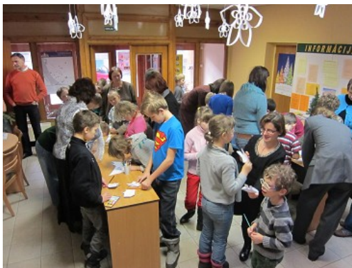
Ģimenes svin Ziemassvētkus RCB Sarkandaugavas filiālbibliotēkā

Ģimenes iesaistīšana lasīšanas veicināšanā ir ļoti nozīmīga, tāpēc RCB bērnu mājaslapas sadaļā "Info vecākiem" ir ievietota informācija un materiāli par lasīšanas nozīmību un populārākajiem bērnu literatūras izdevumiem. Par šiem tematiem RCB bibliotekāri arī stāstīja, piedaloties vecāku sapulcēs bērnudārzos un skolās, tika izplatīti publicitātes materiāli – plakāti, bukleti. Vairākās RCB filiālbibliotēkās bērnu nodaļās izveidots tematisks plaukts vecākiem, kur novietota literatūra par bērnu attīstību, audzināšanu, brīvā laika pavadīšanas veidiem utt. (RCB Imantas filiālbibliotēka, RCB filiālbibliotēka "Pārdaugava" u.c.), bet pieaugušo nodaļās tika izvietota informācija par bērnu krājumu un aktuālajiem pasākumiem. Atsevišķās RCB filiālbibliotēkās (RCB Sarkandaugavas, Ķengaraga filiālbibliotēka un RCB filiālbibliotēka "Vidzeme") jau tradicionāli ir pasākumi, uz kuriem tiek aicināta ģimene, ne tikai mazuļi kopā ar vecākiem, bet arī pusaudži ar vecmāmiņām, vectētiņiem.