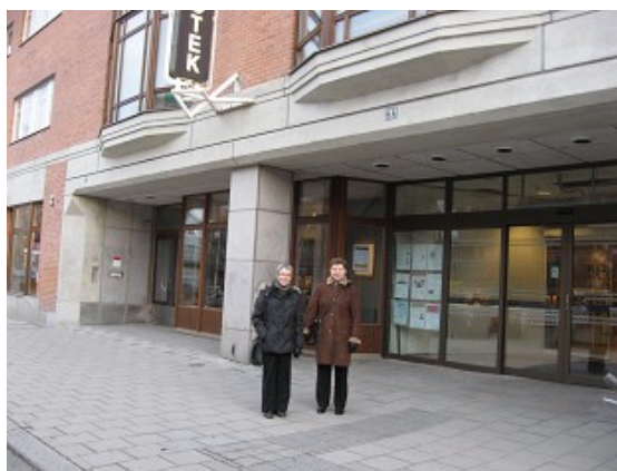
Projekta „Bibliotekārie pakalpojumi ieslodzījuma vietās” dalībnieces Ūmeo

2011.gadā tika atbalstīts RCB projekta pieteikums „ Ceļojošā foto izstāde „Viena diena bibliotēkas dzīvē” ” Rīgas domes Kultūras projektu finansēšanas konkursā. Apstiprinātais finansējums projektam - 460,00 LVL . Vienu dienu izstādi varēja aplūkot RCB 105 gadu konferences dalībnieki Mazajā Ģildē, bet novembrī - RCB „Vidzeme” apmeklētāji (skat. arī pārskata sadaļu „Kopdarbība ar pašvaldības un citām institūcijām. Publicitāte”).