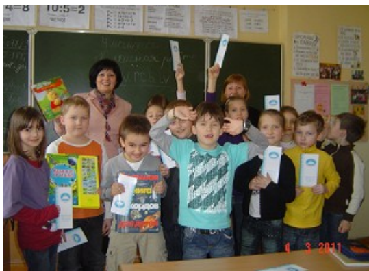
Starpbrīdis skolā kopā ar RCB Bērnu literatūras nodaļas bibliotekāru

Tikai dažās RCB filiālbibliotēkās 2011.gadā turpināta tematisko mapju veidošana. Pieprasītas bijušas novadpētniecības un par populāriem tematiem veidotās mapes (RCB Pļavnieku, Jaunciema filiālbibliotēka un RCB filiālbibliotēka "Strazds", "Pūce"). Lai iepazīstinātu bērnus ar jaunieguvumiem, veidotas PowerPoint prezentācijas (RCB filiālbibliotēka "Vidzeme"), sastādīti jaunieguvumu saraksti (RCB Čiekurkalna, Jaunciema filiālbibliotēka un RCB filiālbibliotēka "Zemgale"), organizēti jaunieguvumu apskati (RCB Sarkandaugavas, Ilģuciema, Ķengaraga filiālbibliotēka un RCB filiālbibliotēka "Zemgale", "Zvirbulis").