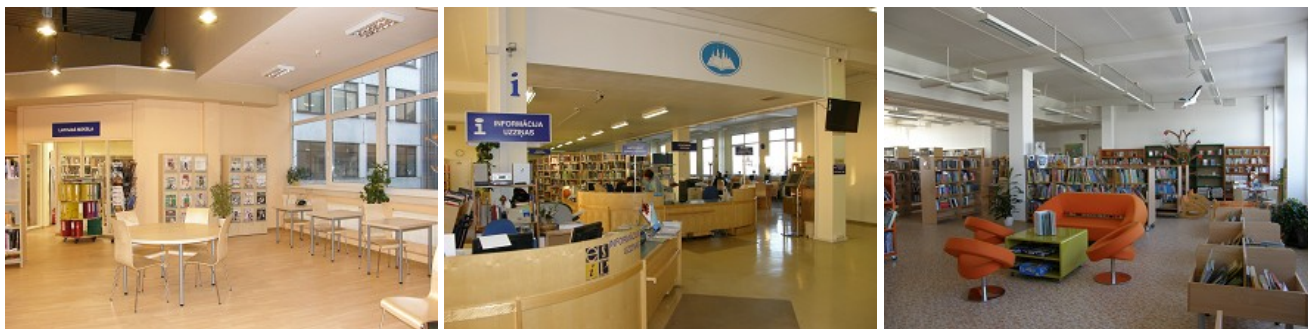
Rīgas Centrālās bibliotēkas telpas Brīvības ielā 49/53

2011.gada 23.jūnijā RCB tika piešķirtas papildus telpas 2.stāvā, Brīvības ielā 49/53, Rīgā.