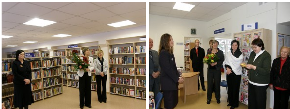
RCB Biķernieku filiālbibliotēkas un Jaunciema filiālbibliotēkas atvēršanas pasākums