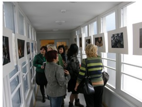
Sanktpēterburgas M.Ļermontova Centrālās bibliotēkas izstāde „Tautu pasakas” un „Grāmatas tēls” RCB filiālbibliotēkā „Vidzeme”