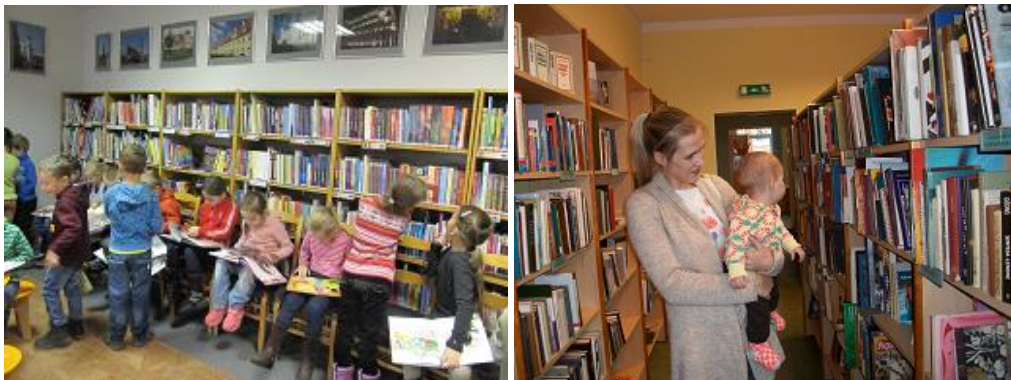
RCB Bišumuižas filiālbibliotēka un filiālbibliotēka „Zemgale” mazākajiem lasītājiem

Sākumskolas skolēni priekšroku dod aktīvai darbībai, tāpēc darbā ar tiem pārsvarā tika izmantotas atraktīvas metodes un formas. Populāras bija dinamiskās komandu sacensības, aizrautīgās "detektīvu spēles", interesantas un noderīgas bijušas praktiskas nodarbības, kurās bērni iepazīna RCB mājaslapu, blogu bērniem, elektronisko katalogu (RCB Čiekurkalna, Biķernieku, Sarkandaugavas, Pļavnieku filiālbibliotēka, filiālbibliotēka "Strazds", "Vidzeme", "Zvirbulis" u.c.). Labprāt 1.-4. klašu skolēni iesaistījās akcijās, konkursos, viktorīnās, radošajās nodarbībās: stāstu sacerēšanā, interesantu lietu veidošanā, zīmēšanā u.c.