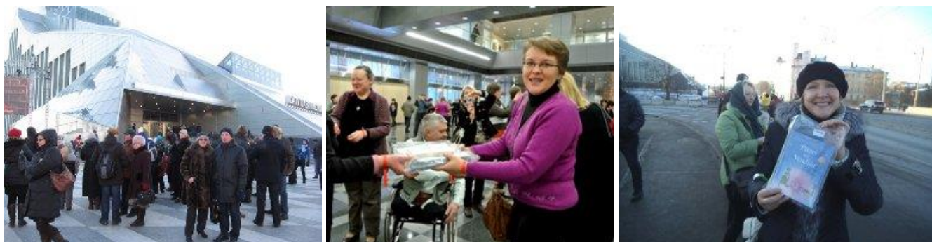
RCB darbinieki „Grāmatu draugu ķēdē”

RCB atbalstīja akciju „Gaismas ceļš – Grāmatu draugu ķēde”.