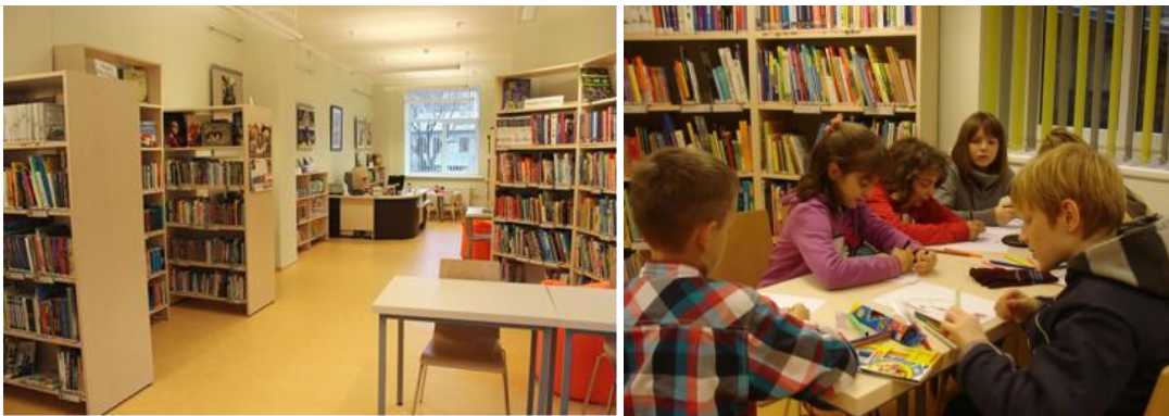
Atjaunotā bērnu nodaļa RCB filiālbibliotēkā "Avots"

Izvērtējot RCB pasākumu kopumu bērniem un jauniešiem, jāsecina, ka tas ir bijis ļoti intensīvs – organizēti 1488 pasākumi (77% no RCB pasākumu kopskaita). Detalizēta informācija par paveikto ir pieejama RCB blogā bērniem http://bibliotekabērniem.rcb.lv/ , kur ir lasāmi īsi interesantāko pasākumu apraksti, skatāms visu RCB pasākumu bērniem kalendārs. 2014.gadā nozīmīgākie un visvairāk atklātie temati bija: "Rīga – Eiropas kultūras galvaspilsēta" un bērnu grāmatu rakstnieces un ilustratores Margaritas Stārastes godināšanas pasākumi, atzīmējot 100 gadu jubileju. Rīgu izzinot, bērni meklēja atbildes uz viktorīnu jautājumiem, skatīja daudzveidīgas izstādes, piedalījās pētnieciskos bibliotēku apkaimes iepazīšanas pasākumos: apskatos, konkursos, ekspedīcijās (RCB Ķengaraga, Imantas, Ilģuciema filiālbibliotēka un filiālbibliotēka "Zemgale", "Zvirbulis" u.c.). Izcilās rakstnieces Margaritas Stārastes dzīvi un daiļradi bērni iepazīna, gan piedaloties tematiskajos pasākumos (RCB Čiekurkalna, Grīziņkalna, Ilģuciema, Jaunciema, Juglas, Pļavnieku filiālbibliotēka un filiālbibliotēka "Zvirbulis", "Zemgale", "Avots"), gan iesaistoties aktivitātēs: akcijā, konkursā, krustvārdu mīklu minēšanā, vēstules rakstīšanā rakstniecei, fotoizstādes iepazīšanā (RCB Imantas, Juglas filiālbibliotēka u.c.).