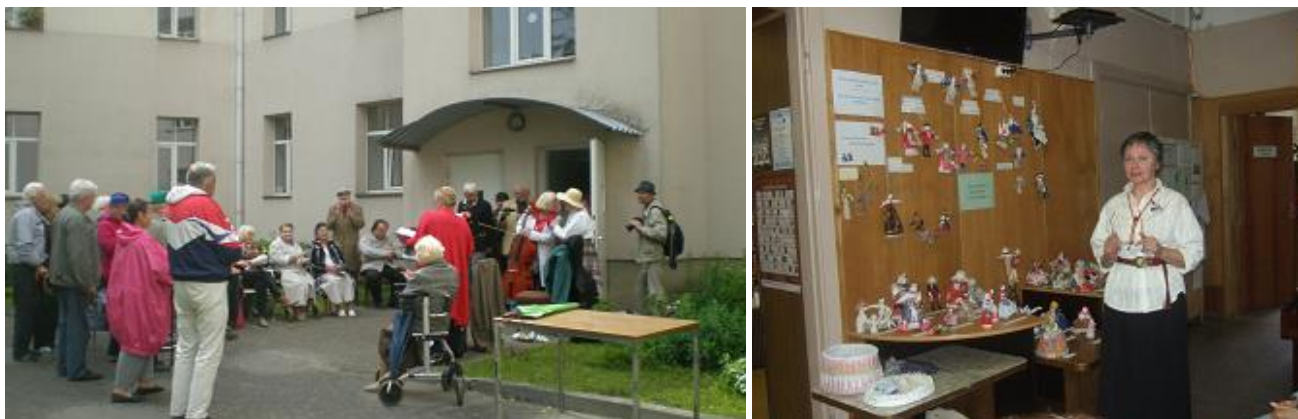
RCB Ķengaraga filiālbibliotēkas organizētie pasākumi