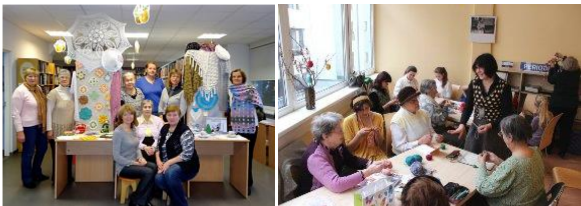
RCB Bišumuižas filiālbibliotēkas un RCB rokdarbnieces

Radoši darboties un pilnveidot savas prasmes bibliotēkās vēlējās rokdarbnieki. Lasītāju klubu nodarbībās bibliotēkas izdevumos tika pētīti rokdarbu paraugi, apgūtas praktiskas iemaņas, veidotas savu darbu izstādes (RCB Pieaugušo nodaļa un Bišumuižas, Imantas, Ilģuciema, Ķengaraga filiālbibliotēka). Prāta spēlēs iesaistījās šahisti (RCB Ilģuciema, Pļavnieku filiālbibliotēka), kopā pulcējās veselīga dzīvesveida piekritēji un sportisko aktivitāšu cienītāji (RCB filiālbibliotēka "Vidzeme" un ārējais apkalpošanas punkts "Saulaino dienu bibliotēka" BKUS). Sava cienītāju un regulāro dalībnieku loks bija māmiņu klubam "Mazulis bibliotēkā", ceļotāju un ceļojumu klubam "Sermo", "Gudro pircēju klubiņam", lasītāju klubiem "Sarunas par dzīvi, kultūru un vidi", "Gaismas stars" (RCB filiālbibliotēka "Vidzeme"), interešu klubam "Vācu nams" (RCB Šampētera filiālbibliotēka).