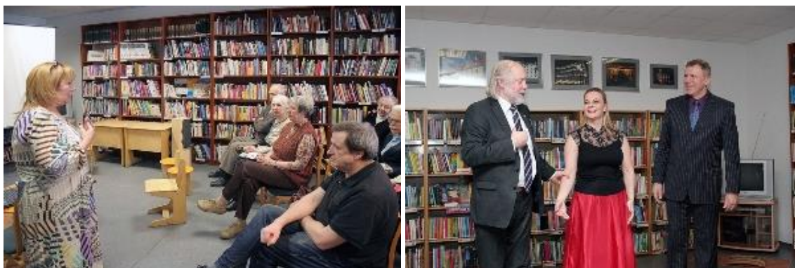
RCB Bišumuižas filiālbibliotēkas viesi: kinorežisore Dzintra Geka, pianists Ventis Zilberts, solisti Aivars Krancmanis un Evita Pehlaka