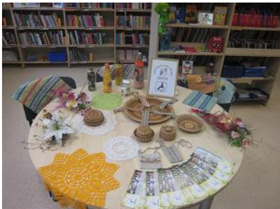
Latvijas Sieviešu invalīdu asociācijas "Aspazija" rokdarbu izstāde RCB Grīziņkalna filiālbibliotēkā

RCB filiālbibliotēku sadarbība ar Rīgas sociālajiem dienestiem un aprūpes iestādēm, iespēju robežās nodrošināta bibliotekāro pakalpojumu saņemšana dzīvesvietā tiem, kuri paši nespēj apmeklēt bibliotēku. Arvien vairāk lasītāju ir izmantojuši iespēju saņemt/nodot RCB izdevumus ar atbalsta personu (radu, kaimiņu, draugu, sociālo darbinieku u.c.) palīdzību, iesniedzot pilnvaras. Veikta izdevumu piegāde gan individuāliem lasītājiem ar pārvietošanās grūtībām (RCB Bišumuižas, Biķernieku, Juglas, Ķengaraga filiālbibliotēka un filiālbibliotēka "Vidzeme"), gan pensionātu un sociālo māju iemītniekiem. Piemēram, RSAC "Mežciems" 38 lasītājiem gada laikā izsniegta 630 grāmatas (RCB filiālbibliotēka "Strazds"), divas reizes mēnesī izdevumu izsniegšana/nodošana bija pieejama sociālās mājas Rēznas ielā iemītniekiem, kur darbu atvieglojis saņemtais portatīvais dators (RCB