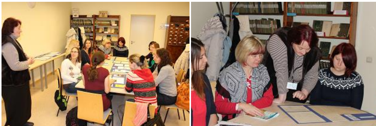
LKA Latvijas Kultūras koledžas studenti RCB filiālbibliotēkā „Vidzeme”