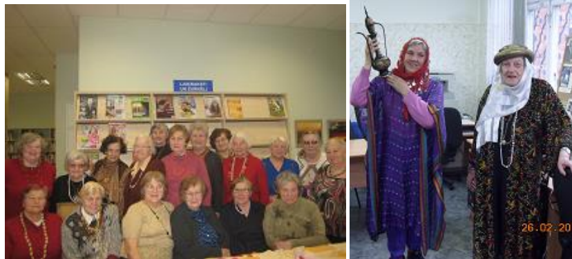
Kreļļu balle RCB Grīziņkalna filiālbibliotēkas senioru klubam „Saulīte” un Austrumu balle RCB Torņakalna filiālbibliotēkas senioriem „Saulspuķe”

kopā svinēja svētkus un "Kreļļu balli", kurā atmiņas par krellēm saistījās ar dzīvesstāstiem, piedalījās Ziemeļvalstu bibliotēku nedēļas skaļajos priekšlasījumos, iepazīna bibliotēkas apkaimi. Savukārt, RCB Torņakalna filiālbibliotēkā 16 pasākumi klubiņiem "Sievietes sievietes gados" un "Saulspuķe" bija veltīti tematam "Iepazīsim Latvijā dzīvojošās tautas caur kultūras daudzveidību!". Populāru personu iepazīšana, jaunieguvumu apskati, kopīgi muzeju apmeklējumi, ekskursijas, iepazīstot Latvijas novadus, rakstnieku dzīvesvietas pulcēja seniorus lasītāju klubos RCB Juglas, Imantas, Pļavnieku filiālbibliotēkā un filiālbibliotēkā "Strazds", "Zemgale".