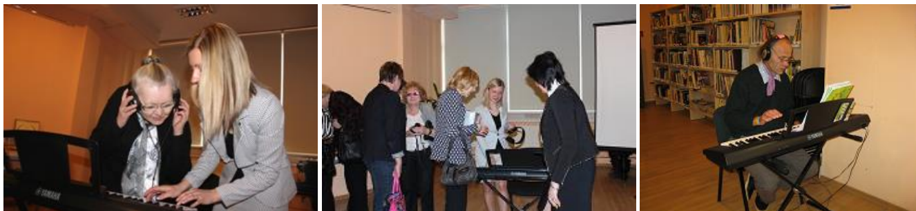
„Klusās” klavieres RCB apmeklētājiem