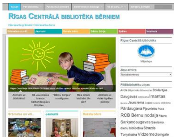
RCB blogs bērniem

Bibliotēku pakalpojumu pilnveidošanai ir uzlabots RCB blogs bērniem (jaunā adrese http://bibliotekabarniem.rcb.lv ), tā saturs, vizuālais noformējums, tehniskais nodrošinājums; organizēta bibliotēkas pakalpojumu saņemšana slimnīcas pacientiem divās nodaļās (RCB ārējais apkalpošanas punkts “Saulaino dienu bibliotēka” BKUS); veikta bērnu nodaļu un zonu labiekārtošana (RCB filiālbibliotēka “Rēzna” un Bolderājas, Ķengaraga, Sarkandaugavas filiālbibliotēka); papildināts datorspēļu (XBox Kinect), rotaļlietu un galda spēļu klāsts.