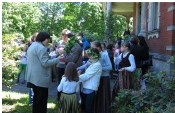
RCB Sarkandaugavas filiālbibliotēkas Jāņu pasākums „Dauderos”

Sarkandaugavas ģimenēm Latvijas Nacionālā vēstures muzeja nodaļas „Dauderi” parkā tika rīkots Jāņu pasākums „Visi tek skatīties, Kur atbrauca Jāņu māte”. Lielu atzinību guva ikgadējā bibliotēkas Ziemassvētku eglīte ģimenēm ar bērniem, kurā piedalījās vairāk nekā 40 ģimenes. „Sarkandaugavas strādnieku svētkos”, kas notika Muzeju naktī, bibliotēka piedalījās ar pasākumu „Bibliotēka laiku labirintos”, kurā bija gan izstāde un slaidrāde „Sarkandaugavas bibliotēkas laiku labirintos” un pārrunas