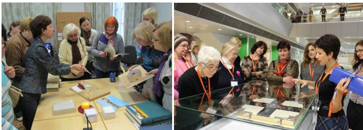
RCB darbinieki Latvijas Nacionālā arhīva bibliotēkā un LNB