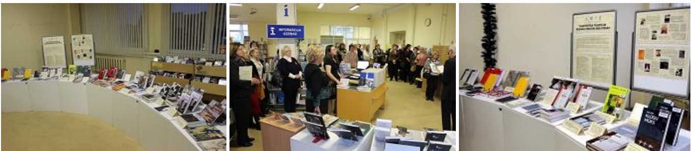
Projekta „Augstvērtīga tulkotā un oriģinālliteratūra bibliotēkās” izstādes atklāšana

RCB krājums papildināts arī projektu līdzfinansētē. Tā kultūras projekta „Augstvērtīga tulkotā un oriģinālliteratūra bibliotēkās” ietvaros RCB krājumu papildināja 171 informācijas resurss par kopējo summu 1330,65 EUR.