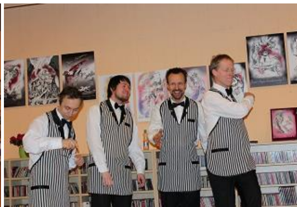
Eiropas dienas koncerts un „Harmonija Rīgai” koncerts RCB