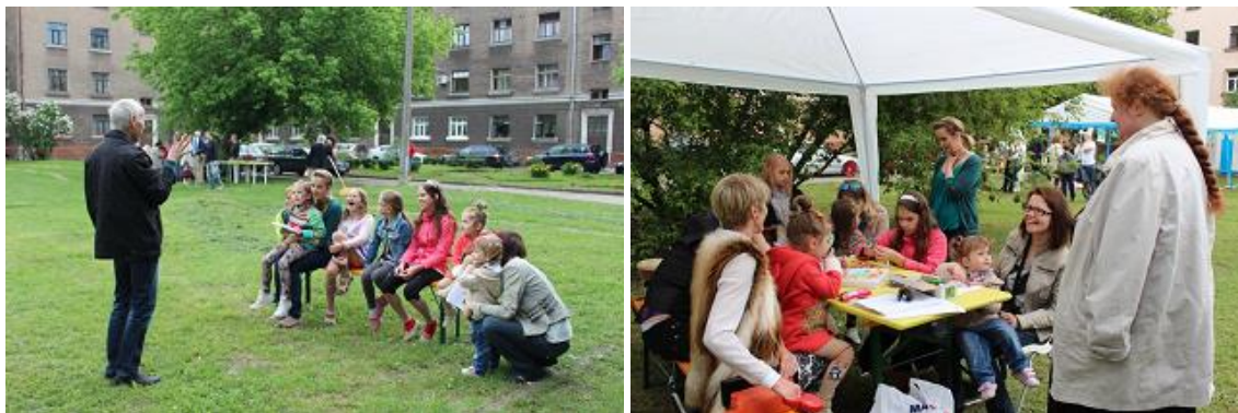
RCB filiālbibliotēkas „Vidzeme” aktivitātes Teikas pagalma svētkos