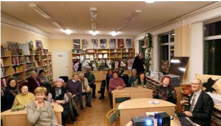
RCB Juglas filiālbibliotēkā viesojas folkloras pētnieks Guntis Pakalns

RCB Juglas filiālbibliotēkā turpinājās lasītāju kluba „Juglas aicinājums” darbība, reizi mēnesī organizējot tikšanos ar novadniekiem, veidojot tematam vai personai veltītas literatūras izstādes vai slaidrādes, bibliogrāfiskos