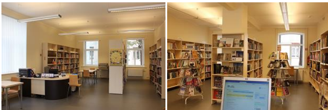
Renovētā RCB filiālbibliotēka „Avots”

14.februārī pēc telpu renovācijas darbu atsāka RCB filiālbibliotēka „Avots”. 2014.gadā Rīgas domes (RD) Īpašuma departaments (ĪP) veica jauno RCB Daugavas filiālbibliotēkas telpu Aviācijas ielā 15 renovāciju.