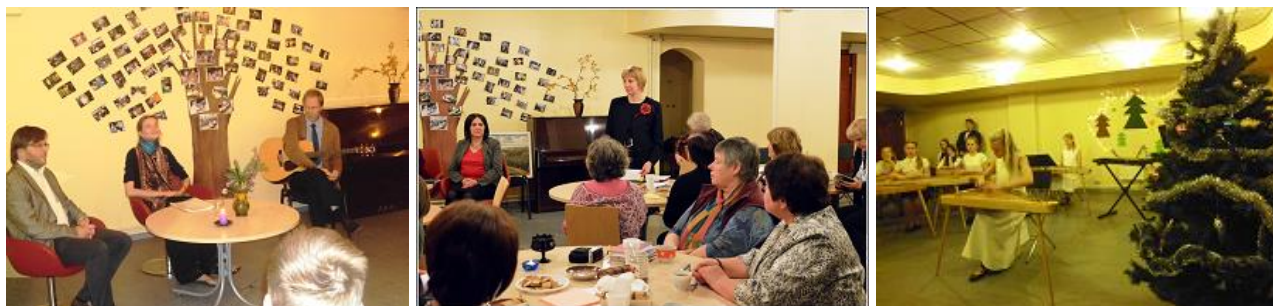
Literāri muzikālie pasākumi RCB Imantas filiālbibliotēkā