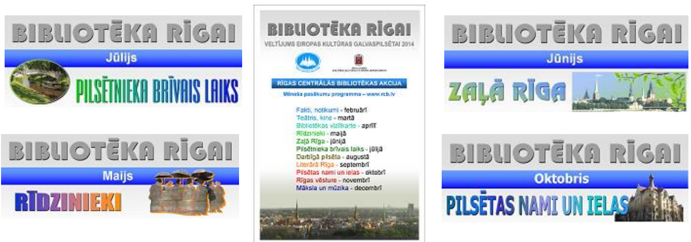
Akcijas „Bibliotēka Rīgai” vienotais noformējums

Turpināja iznākt RCB Bibliotēku dienesta sagatavotais RCB informatīvais izdevums „Jaunās Vēstis” (pieejams arī RCB tīmekļa vietnes sadaļā „Publikācijas”). Gada otrajā pusē, mainot izdevuma koncepciju, tajā tiek publicēta profesionālajā jomā aktuāla informācija un informācija par pasākumiem un aktualitātēm, kas nozīmīga visai RCB sistēmai. Atsevišķu filiālbibliotēku rīkoto pasākumu apraksti un fotogrāfijas tiek publicētas RCB tīmekļa vietnē un profilos sociālajos tīklos.