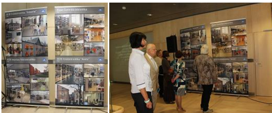
Izstāde „Latvijas mazās gaismas pils” LNB