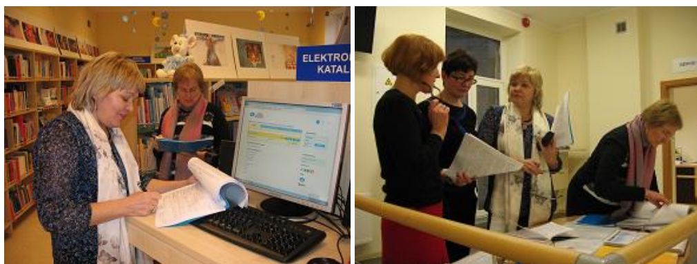
Akreditācijas komisija RCB filiālbibliotēkās „Vidzeme” un „Avots”