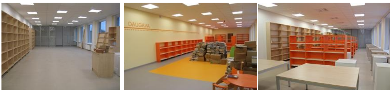
RCB Daugavas filiālbibliotēkas iekārtošana Aviācijas ielas 15 telpās

Pārskata gadā par RCB budžeta līdzekļiem tika veikti telpu uzturēšanas remontdarbi RCB sekretariātā un 7.stāva darbinieku telpā, 2.stāva gaitenā telpās Graudu ielā 59 un Pļavnieku filiālbibliotēkā.