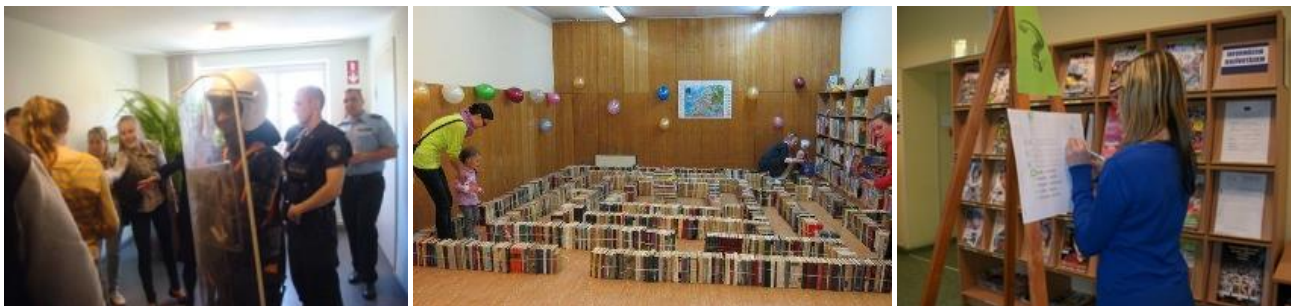
Pasākumi RCB Biķernieku un Sarkandaugavas filiālbibliotēkās un filiālbibliotēkās „Zemgale”

Pusaudži labi orientējas tehnoloģijās, ir prasmīgi to lietotāji, tomēr nereti viņiem trūkst informācijas par uzziņu resursu daudzveidību. Mācību vielas labāku izpratni sekmēja literārās stundas par rakstniekiem, kultūru (RCB Imantas, Čiekurkalna, Sarkandaugavas filiālbibliotēka), skolēnu redzesloku bagātinošas bija tikšanās ar populārām personām (RCB Bērnu literatūras nodaļa, Imantas, Pļavnieku, Torņakalna filiālbibliotēka un filiālbibliotēka "Strazds", "Rēzna"). Populāras bija bibliotekārās stundas – diskusijas par bibliotēku nākotnes perspektīvām, pasaules skaistākajām bibliotēkām un bibliotekāra tēlu (RCB Imantas, Juglas filiālbibliotēka). Raksturīga 2014.gada tendence - pusaudži arvien aktīvāk iesaistījās pasākumu rīkošanā un arī to vadīšanā (RCB Bērnu literatūras nodaļa, Grīziņkalna, Mežciema, Sarkandaugavas filiālbibliotēka un filiālbibliotēka "Strazds"), piedalījās "Ēnu dienā", vēlējās iepazīt un izmēģināt bibliotekāra profesijas ikdienu (RCB Torņakalna, Sarkandaugavas filiālbibliotēka un RCB filiālbibliotēka "Avots").