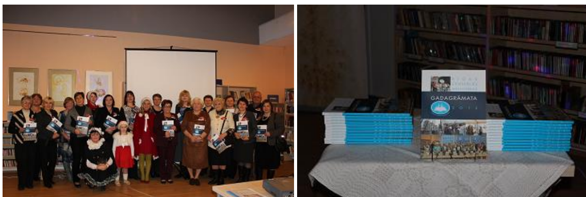
„Rīgas Centrālās bibliotēkas gadagrāmata, 2013” atvēršana notika Ziemassvētku noskaņās

RCB novadpētniecības darbs visa gada garumā tika atspoguļots RCB izdevumos. Pārskata gadā sagatavota un atvērta „Rīgas Centrālās bibliotēkas gadagrāmata, 2013”. Gadagrāmata ir ar izteiktu novadpētniecības saturu. Tās jaunā sadaļa „Tādi mēs esam - vienoti, bet daudzkrāsaini” sniedz ieskatu RCB un filiālbibliotēkās, kolēģos līdzās, atklāj veiksmes stāstus un darbības moto.