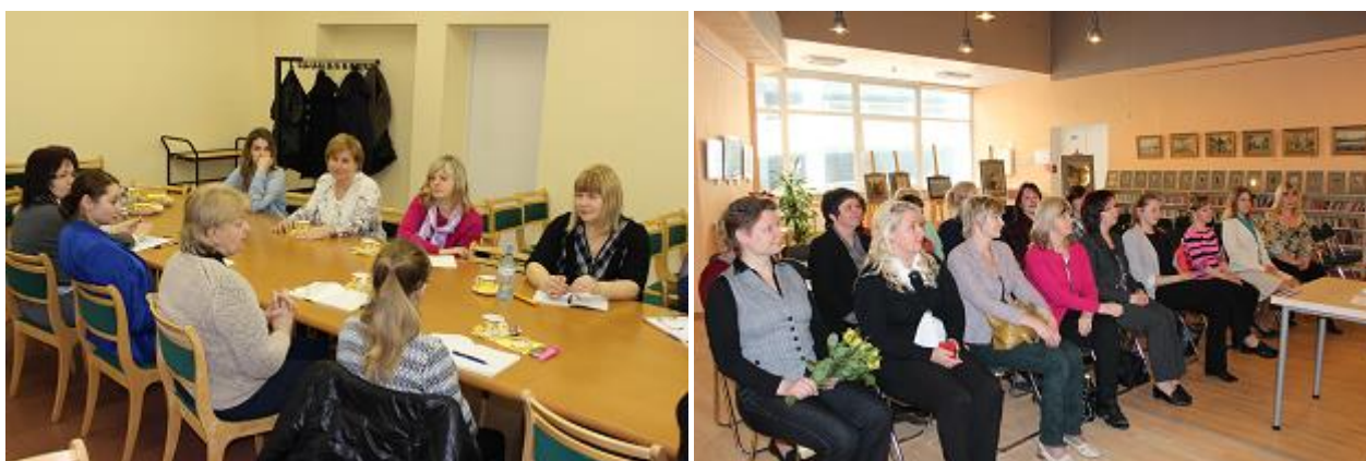
Jauno bibliotekāru skola

Martā-aprīlī astoņiem RCB bibliotekārajiem darbiniekiem ar darba stāžu RCB 0-1 gads tika organizēts tradicionālais mācību kurss „Jauno bibliotekāru skola” par darba procesu organizēšanu RCB, bibliotekārā darba pamatiem un aktualitātēm. Nodarbības vada RCB Bibliotēku dienesta un Automatizācijas nodaļas speciālisti ar mērķi veidot piederības sajūtu RCB. Pilnu mācību kursu veidoja 36 akadēmiskās stundas un tā beigās ikviens jaunais darbinieks veica pārbaudes testu.