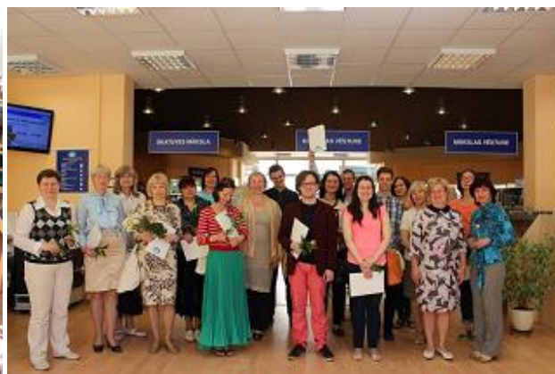
Jauno bibliotekāru skolas nodarbība un izlaidums