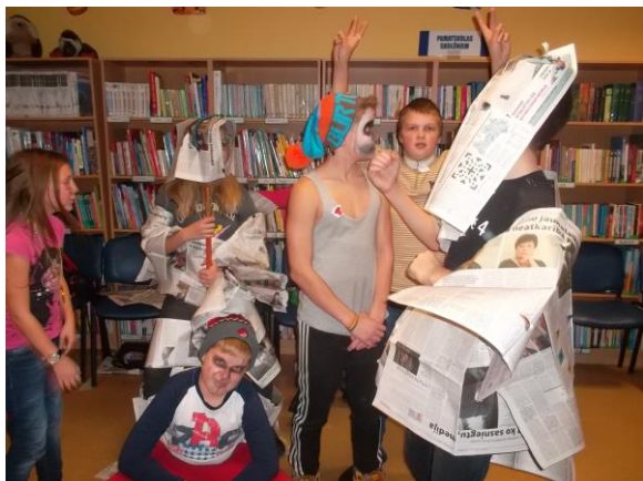
RCB Jaunciema filiālbibliotēkas lasītāju klubīņa bērni atzīmē Helovīna dienu

Vairākus gadus RCB filiālbibliotēkās notiek pasākumi interesentiem, kuros aicināts piedalīties jebkurš, kas to vēlas. Vadošais motīvs šo pasākumu rīkošanai – radīt bērniem un pusaudžiem interesantu vidi, aicināt aktīvai līdzdarbībai. Parasti pasākumu norises laiks – darbdienu pēcpusdienas, kad bērni beiguši mācības skolā, un sestdienas, skolas brīvlaiki. Lasītāju klubīņos pulcējās pastāvīgie pasākumu dalībnieki, kuri bibliotēkas aktivitātes atzinuši par tik interesantām, lai tajās piedalītos vēl un vēl. Lasītāju grupā "Mūsu sētas bērni" (RCB filiālbibliotēka "Zvirbulis") populāras bija "Spēļu spēles" - lego, šautriņas, paslēptu mantas meklējumi, āra spēles u.c. Jauno lasītāju klubā "Lapaspušu melnajā caurumā" (RCB Imantas filiālbibliotēka) pulcējās grāmatu un lasīšanas fani, bet "Lotes klubīnā" (RCB Juglas filiālbibliotēka) tika pilnveidotas latviešu valodas prasmes. Visaktīvākie bijuši bērnu klubīņa "Gudrinieciņi" (RCB Jaunciema filiālbibliotēka) dalībnieki - notikušas 12 tematiskas nodarbības.