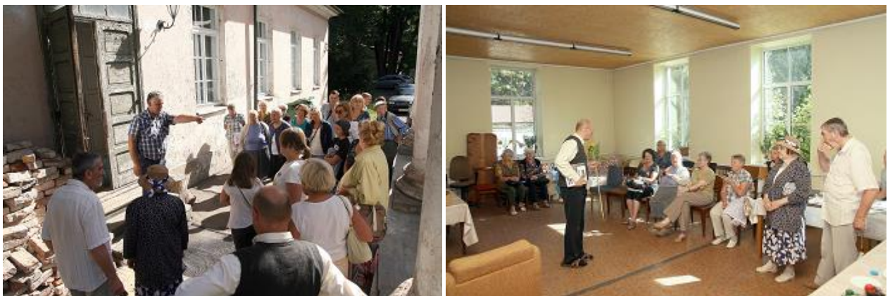
Tikšanās Bišumuižā