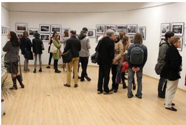
Grupas TF4 fotoizstādes „Totāla fotogrāfija / Dublis Nr.5” atklāšana