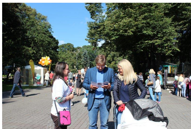
Bibliotēkas piedāvājumu iepazīst Rīgas mērs Nils Ušakovs ar ģimeni

Nozīmīga bija RCB dalība Rīgas Interesu centra organizētajā pasākumā Vērmanes dārzā "Nāc un piedalies". Svētku laikā RCB informatīvajā un radošo darbnīcu teltī bija iegūstama visplašākā informācija par bibliotēku, tās pakalpojumiem, bet bērniem jautrību un interesi rosināja dalība aktivitātēs: kolāžu veidošanā par pasaku tēliem, ātrlasīšanas un burbuļu pūšanas sacensībās, dzejoļu veidošanā, aizpildot tekstā tukšās vietas, darba lapu aizpildīšanā, kurās jāmeklē grāmatu tēlu pazudušās lietas. Bija arī jāiesaka grāmata tētim, jo pirmo gadu svētku laikā notika arī aktivitātes Tēvu