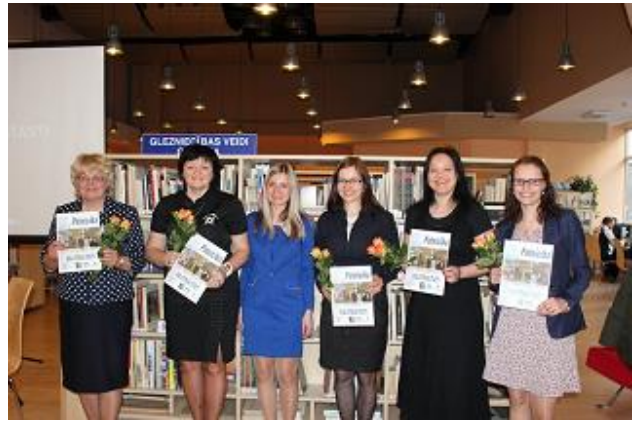
RCB rīkoto „Bibliotēkas stāstu” dalībnieces

Centrālajā bibliotēkā interesi raisīja pasākums „Bibliotēkas stāsti”. Tā dalībnieki pat iesaka arī citās bibliotēkās apkopot savu kolēģu, bibliotekāru stāstus par katra individuālo pieredzi šajā profesijā, jo katrs stāsts ir unikāls un īpašs, tāpēc ļoti vajadzīgs bibliotēkas hronikas lappušu aizpildīšanai. Izskan priekšlikums pasākumu „Bibliotēkas stāsti” ieviest par tradīciju, kas ik gadu Bibliotēku nedēļā notiktu Centrālajā bibliotēkā un filiālbibliotēkās. Tas būtu pasākums, kurā pulcējas gan bibliotekāri, gan ilggadējie, uzticamie bibliotēkas lasītāji, kuru stāstus arī varētu apkopot un izstāstīt.