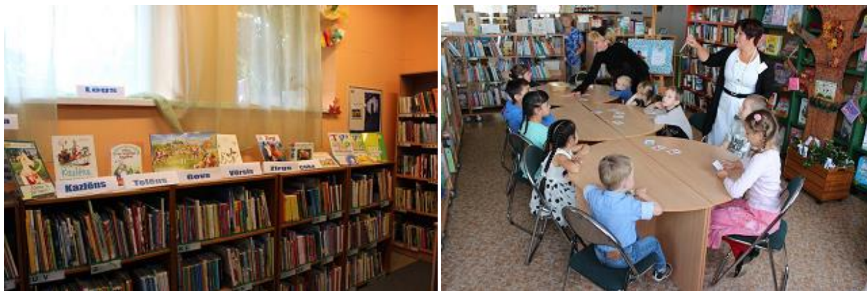
Bilingvālās nodarbības RCB filiālbibliotēkā „Rēzna” un Bērnu literatūras nodaļā

Tā kā latviešu valodas prasmju pilnveidošana pirmsskolas vecuma bērniem ir aktualitāte daudziem Rīgas iedzīvotājiem, vairākās RCB filiālbibliotēkās bilingvālu nodarbību organizēšana tiek turpināta arī pēc projekta noslēguma.