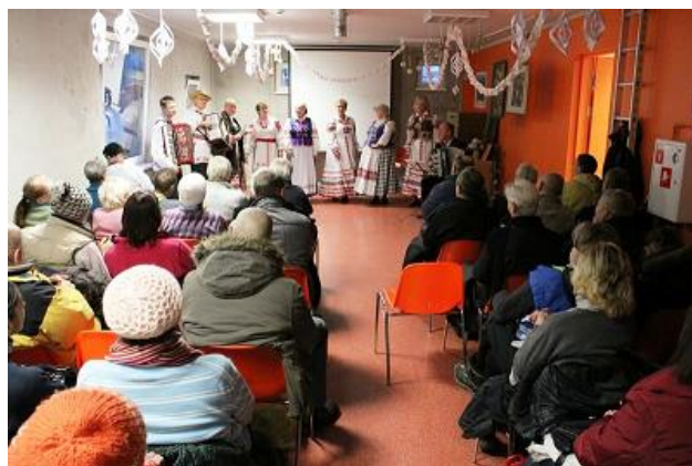
Ziemassvētku koncerts Rīgas patversmes Dienas centrā