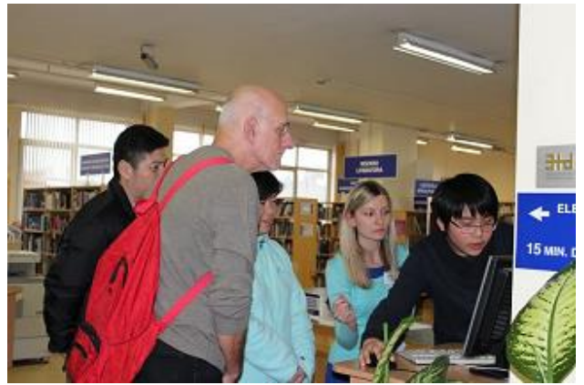
Trešo valstu valstspiederīgie viesojas RCB

Projektu „Esam rīdzinieki!” īsteno RD IKSD sadarbībā ar Rīgas Izglītības un informatīvi metodisko centru ar Eiropas Trešo valstu valstspiederīgo integrācijas fonda (75%) un valsts budžeta līdzekļu (25%) finansējumu. Projekta mērķis ir attīstīt kvalitatīvas, brīvi pieejamas trešo valstu valsts piederīgo adaptācijas programmas un integrācijas pasākumus, kā arī veicināt un atbalstīt trešo valstu valstspiederīgo ar dažādu kultūras, reliģijas, valodas un etnisko izcelsmi integrāciju Latvijas sabiedrībā.