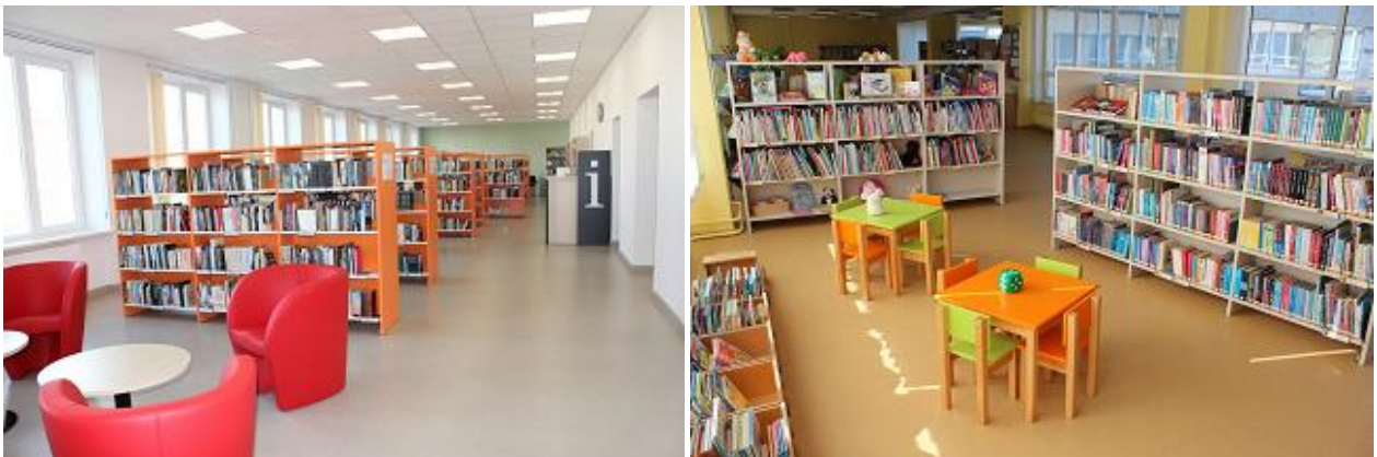
RCB Daugavas filiālbibliotēka un Iļģuciema filiālbibliotēka

30.aprīlī pēc pārcelšanās un telpu renovācijas darbu atsāka RCB Daugavas filiālbibliotēka, bet kopš 16.septembra pēc grīdas seguma maiņas lietotāju apkalpošanas zonā un daļēja telpu remonta – RCB Iļģuciema filiālbibliotēka.