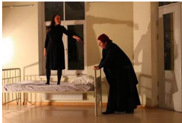
VEF Kultūras pils teātra izrāde “Pārpratums”