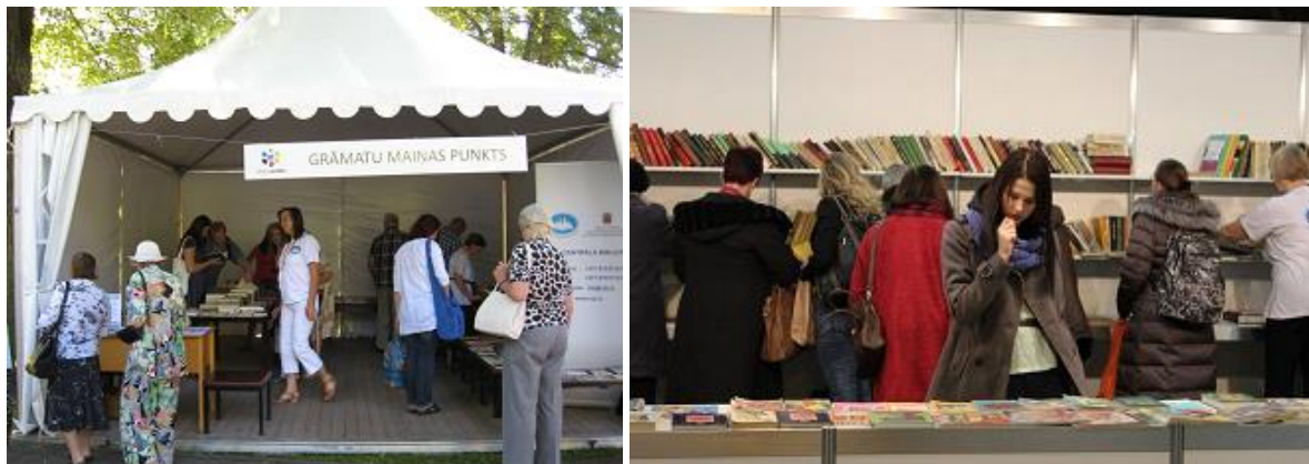
RCB grāmatu maiņas punkti Rīgas svētkos un Ķīpsalā

Ievērojams darbs RCB Repozitārija Apmaiņas fondā veikts ar informācijas resursiem, kuri nodoti citām institūcijām. Bezmaksas dāvinājumos kopumā nodots 9 531 eksemplārs, no kuriem 5 452 - 9 Latvijas publiskajām bibliotēkām, 347 – izglītības iestādēm, bet 814 eksemplāri nodoti citām iestādēm. 2015.gadā pilsētas un valsts pasākumu ietvaros RCB Apmaiņas fonds ar grāmatām piedalījās 5 grāmatu maiņas punktos, izsniedzot 2 918 iespieddarbus.