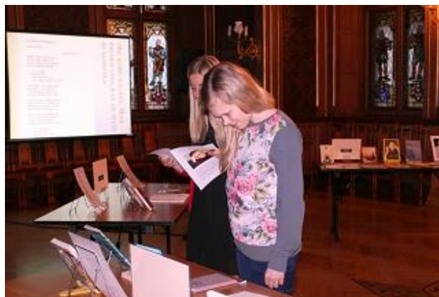
Dzejniekam Marim Čaklajam veltītā izstāde Mazajā Ģildē