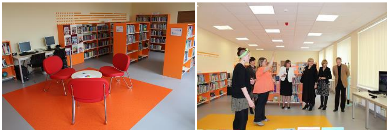
RCB Daugavas filiālbibliotēkas Bērnu literatūras nodaļa

Atsākot darbu, RCB Daugavas un Ilģuciema filiālbibliotēka bija tehniski sagatavotas lasītāju apkalpošanai: tika uzstādīta visa datortehnika, pārbaudīta interneta pieslēguma darbība, kā arī iegādāts jauns informatīvais TV monitors RCB Ilģuciema filiālbibliotēkai un xBox spēļu konsole RCB Daugavas filiālbibliotēkai.