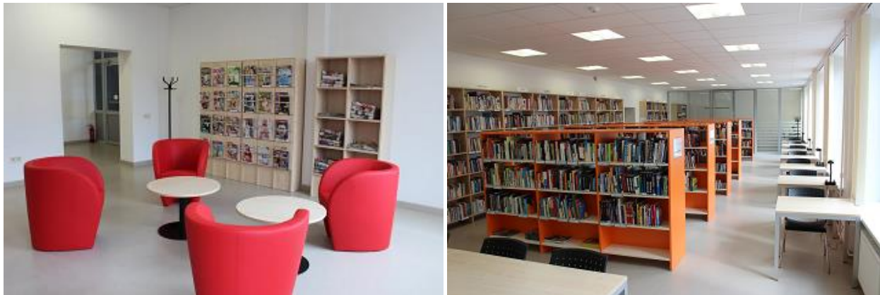
Krājuma izvietojums RCB Daugavas filiālbibliotēkā

Pārskata periodā RCB Bibliotēku dienestā tika izstrādāts jauns temats „Vaļasprieki”, ko savā krājumā aprobēja RCB Daugavas filiālbibliotēka, darba gaitā to vērtējot atzinīgi. 2015.gada noslēgumā RCB Torņakalna filiālbibliotēka kā pirmo tematiskam kārtojumam izvēlējās tieši šo tematu.