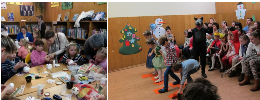
Pasākumi ģimenēm RCB Ķengaraga un Sarkandaugavas filiālbibliotēkās