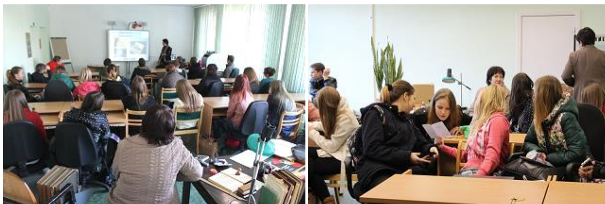
Karjeras diena RCB Komplektēšanas un apstrādes nodaļā

RCB filiālbibliotēkas, kuras nav veikušas ierakstus datubāzē: RCB filiālbibliotēka „Pūce”, „Strazds”, „Zemgale”, RCB Bišumuižas, Jaunciema, Mežciema, Pļavnieku filiālbibliotēka.