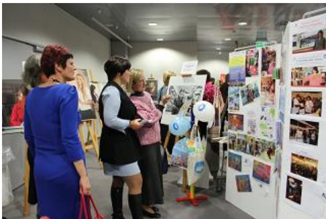
RCB stends „Ideju tirgū”

Sadarbībā ar LNB Bibliotēku attīstības centra speciālistiem veikta trūkstošo izdevniecības „Grāmatu Draugs” grāmatu piekomplektēšana H.Rudzīša lasītavai.