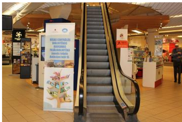
Reklāma par RCB Daugavas filiālbibliotēku tirdzniecības centrā „Dole”