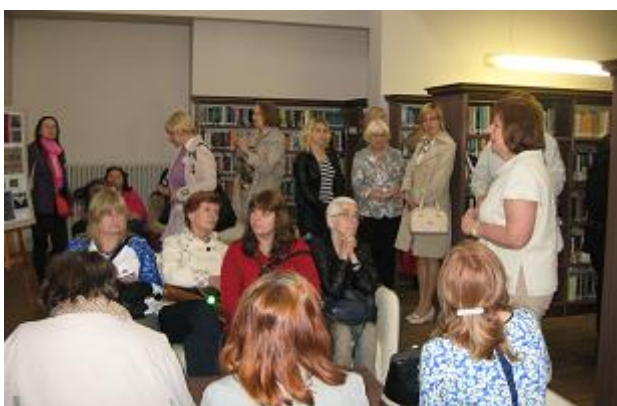
RCB darbinieki Viesos Kuldīgas Galvenajā bibliotēkā

2.jūnijā RCB nodaļu un filiālbibliotēku pārstāvji pieredzes apmaiņā apmeklēja Kuldīgas Galveno bibliotēku un Pelču pagasta bibliotēku.