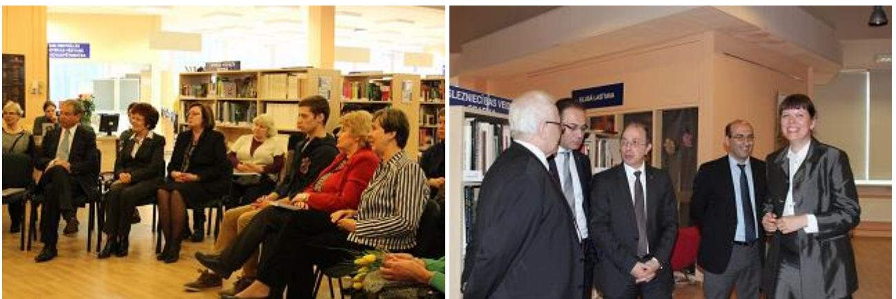
„Jumavas” grāmatu „Durvīs. Tā tas bija” un „Tuksneša meitenes” prezentācija RCB