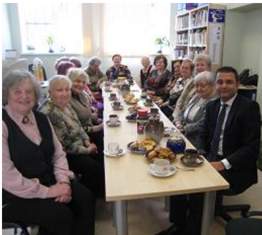
Ar senioru kluba “Saulīte” dalībniekiem RCB Grīziņkalna filiālbibliotēkā tiekas Saeimas deputāts Hosams Abu Meri