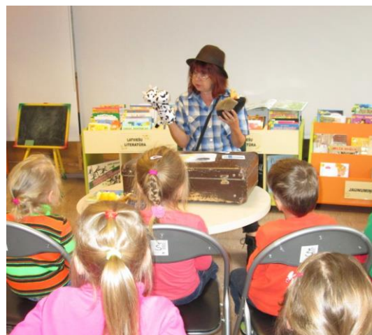
Ziemeļvalstu bibliotēku nedēļas pasākums RCB Šampētera filiālbibliotēkā

2015.gada aktuālākais aktivitāšu temats bija Raiņa un Aspazijas jubileja, kas tika atzīmēta visās RCB filiālēs. Bērni pasākumos iepazīna dzejnieku grāmatas, klausījās dzejas lasījumus, skatījās multfilmas, iesaistījās Raiņa un Aspazijas dzejas lasījumos lomās, dziedāja dziesmas, piedalījās radošajā darbnīcā "Izkrāso dzejoli", (RCB Sarkandaugavas filiālbibliotēka), piedalījās spēlē kopā ar lellīti Lolīti un jautrajā ziepju burbuļu pūšanā (RCB Torņakalna filiālbibliotēka), minēja mīklas (RCB Bolderājas filiālbibliotēka), aizpildīja krāsojamajās lapas par dzejnieku populāro darbu varoņiem (RCB filiālbibliotēka "Pūce"), izmēģināja prasmes dzejas daiļlasīšanas konkursā "Es un Rainis", piedalījās konkursos (RCB Bērnu literatūras nodaļa).