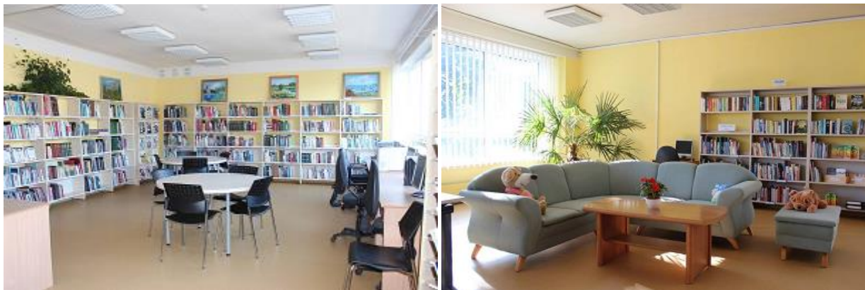
RCB Ilģuciema filiālbibliotēkas telpas pēc remonta

Filiālbibliotēkai „Zvirbulis” Lapu ielā 24 nepieciešamas pilnīgi jaunas telpas.