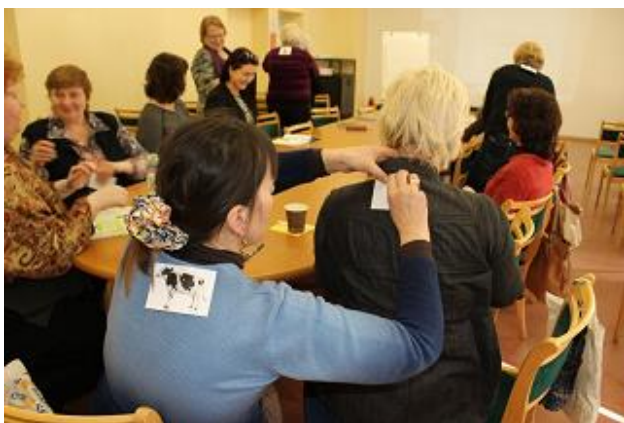
Seminārs „Bilingvālā komunikācija”

Uz nodarbībām „Sāksim runāt latviski?” tika aicināti piedalīties bērni vecumā līdz 7 gadiem, īpaši uzrunājot vecākus, kuru mazuļi neapmeklē bērnudārzu.