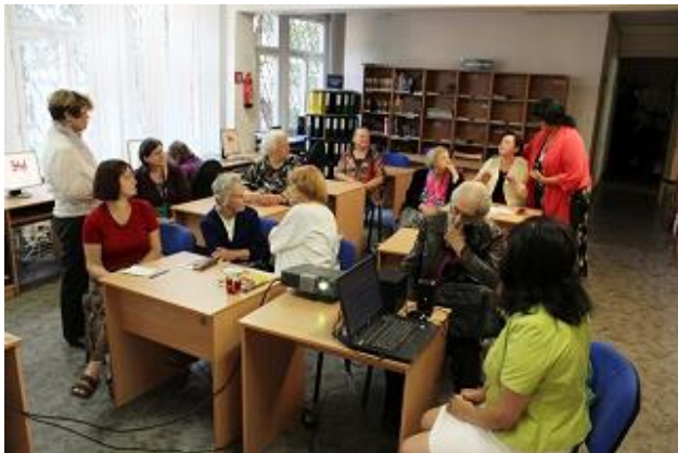
Psiholoģijas lekcija senioriem RCB Torņakalna filiālbibliotēkā

šaha cienītāju tikšanās u.c.), piedalās pasākumos. Ikdienā vērojams – nedaudz mazinājusies interese par datora prasmju apgūšanu, tomēr joprojām daudziem senioriem nozīmīga bijusi e-pasta, sociālo tīklu, Skype lietošanas, norēķinu un maksājumu veikšanas internetā apmācība. Labprātāk seniori vienkāršākās darbības apgūst individuālās nodarbībās un konsultācijās, bet padziļinātas zināšanas iegūst apmācībās grupām, kuras notika atsevišķās filiālbibliotēkās (skat. "Datornodarbības").