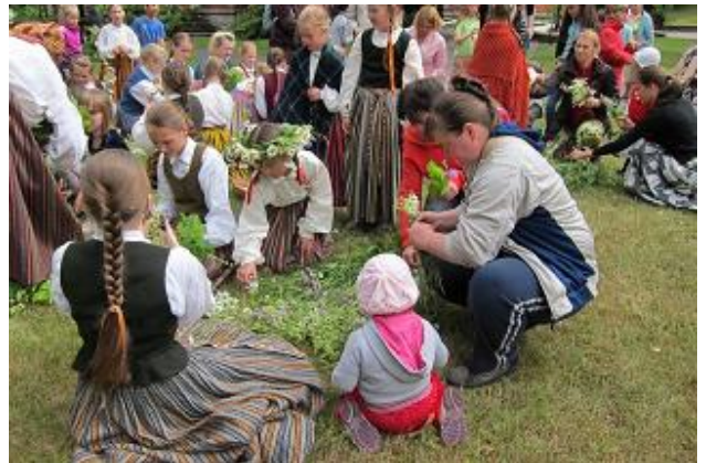
RCB Sarkandaugavas filiālbibliotēkas rīkotie Jāņi ģimenēm

RCB Sarkandaugavas filiālbibliotēkā 2015.gadā notika 9 pasākumi, kuru mērķauditorija bija ģimenes ar bērniem. Piemēram, „Iesim pasakā!” - skaļās lasīšanas pasākums ar uzvedumu, „Ja tu nezini, tad jautā savai zemei, savai tautai” – 4. maijam veltīts tematisks pasākums, lego konkurss „Spēlē, spēlē, ko tu spēlē?”, Jāņu ielīgošana Latvijas Nacionālā vēstures muzeja nodaļas „Dauderi” parkā. Lielu atzinību guva ikgadējā bibliotēkas Ziemassvētku eglīte – akcija „Palīdzēsim vilkam”. Bibliotēkā viesojās rakstnieks