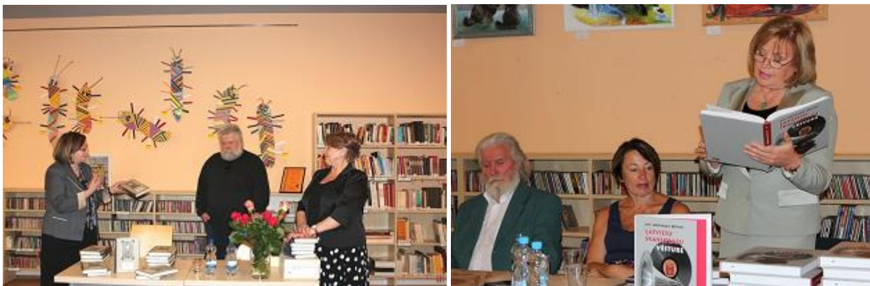
Sadarbībā ar apgādu VESTA-LK bibliotēkā notika „Pūcesbērna patiesie piedzīvojumi Padomijā” un „Latviešu skaņuplašu vēsture” prezentācija