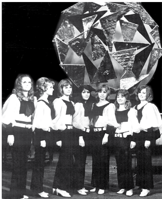
Kultūras pils estrādes dziesmu ansamblis 1972. g.