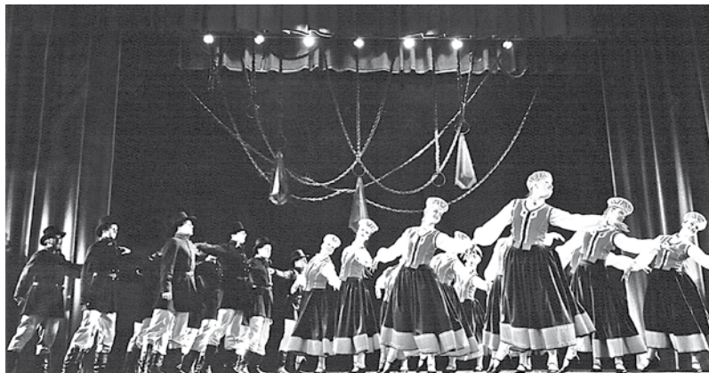
Tautas deju ansamblis „Dardedze” 2015. g.

VEF Kultūras pils Tautas deju ansambļa „Dardedze” Ilzes dienas koncerts [Videoieraksts] : [2013. g. janv., velt. kolektīva vad. Ilzei