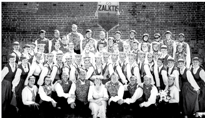
Deju kolektīvs „Zalktis” 2013. g.