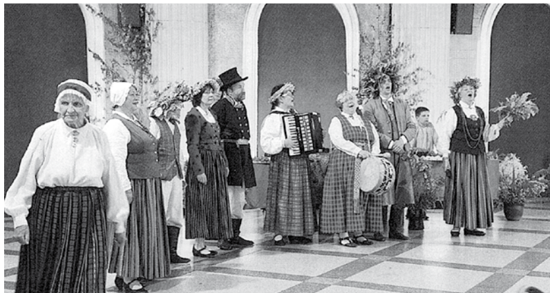
Folkloras kopa „Rija”

Folkloras kopa „Rija” ieskandina [25.] jubileju un Lieldiešanas [Videoieraksts] : 2 daļas : [TV24 raidījums „Rampas ugunis”