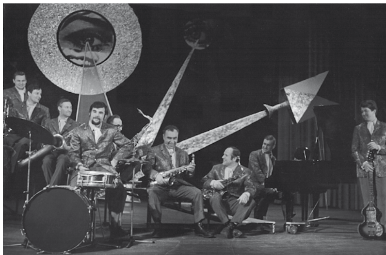
Kultūras pils estrādes orķestris 1971. g.