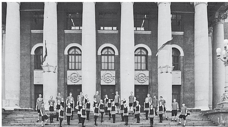
Tautas deju ansamblis „Rotaļa” 2014. g.

TDA „Rotaļa” Valsts svētku koncerts „Man dvēselē ierakstīts Latvijas vārds” : VEF KP, 2015. g. 17. nov. // YouTube. – Tiešsaistes pakalpojums. – Pieejas veids: tīmeklis WWW. URL: https://www.youtube.com/watch?v=k4CMhQwJATo . – Resurss aprakstīts 2017. g. 15. janv.