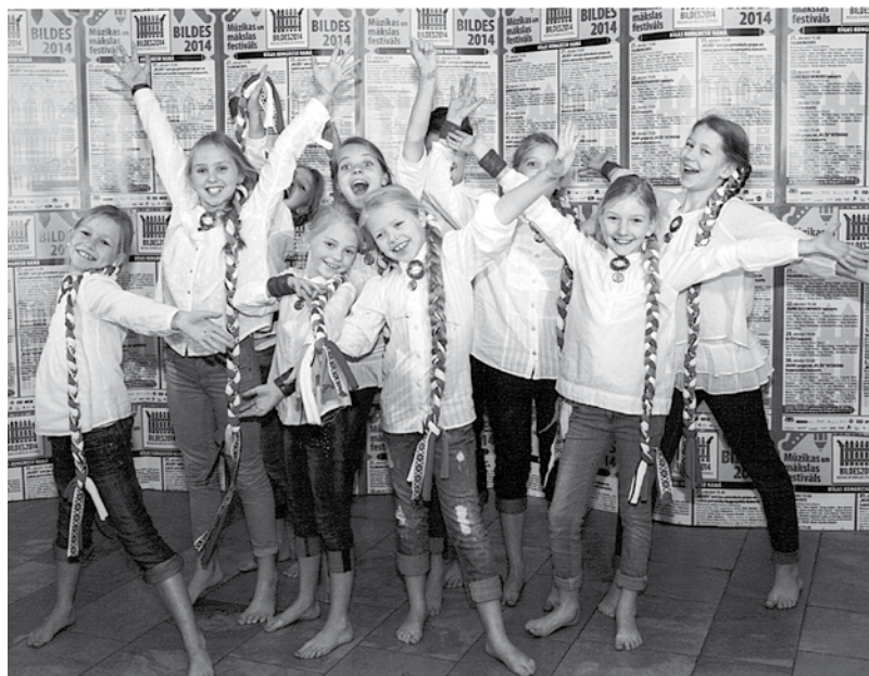
Bērnu vokālais ansamblis „Poppy” 2014. g.

Latviešu tautas dziesmas [Skaņu ieraksts] : karaoke / izp. grupa „Saulēniņi”. – [Rīga] : Dagmāra-stereo, [b. g.]. – 1 CD + [6] lpp. teksta piel. – Izd. Nr. DS CD 037.