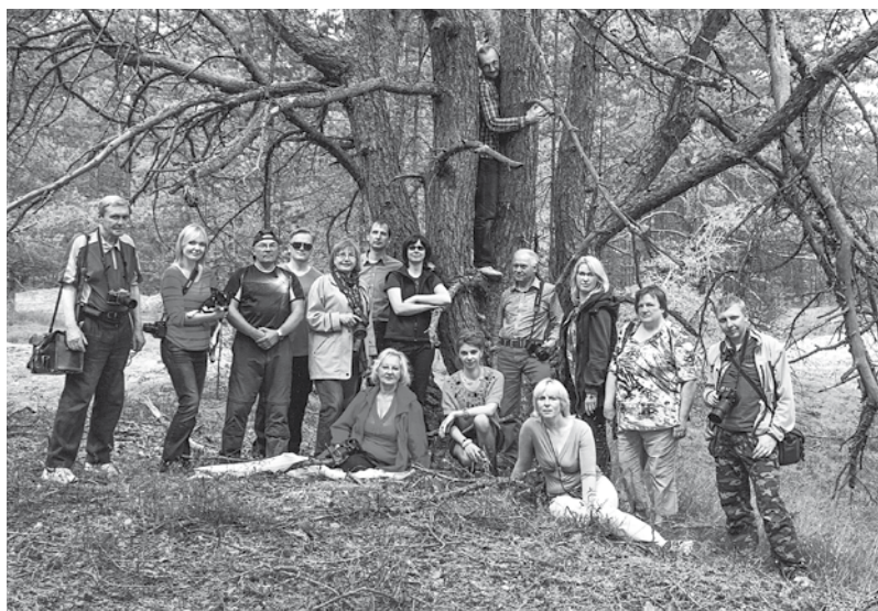
Fotokluba „Rīga” dalībnieki 2015. g.