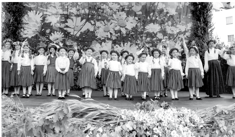
Ansamblis „Momo” 2015. g.