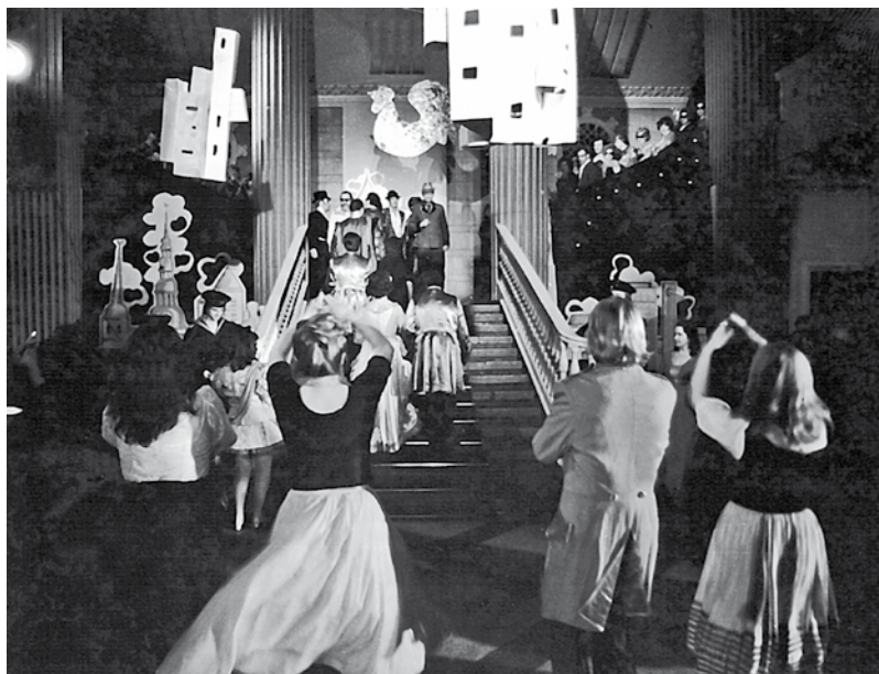
Tradicionālais VEF Kultūras pils māksliniecisko kolektīvu karnevāls

Lejasmeijere Ieva. Pāri Rīgai un laikam, un jūklim : [par Rīgas glezniecības studiju audzēkņu gleznu izstādi „Rīgas laiks” Kultūras pilī] / Ieva Lejasmeijere // Rīgas Laiks. – Nr.7 (2014, jūl.), 67. lpp.