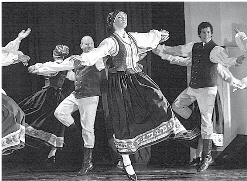
Deju kolektīvs „Mana Rotaļa”