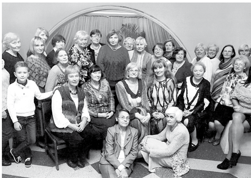
Rokdarbu studija „Atkalnis” 35 gadu jubilejā 2015. g.

Rokdarbu studija. Tās pirmsākums meklējams 1976. gada rudenī, kad Rīgas Elektromehāniskās rūpnīcas (REMR) Kultūras namā tika organizēti adīšanas un tamborēšanas kursi. „Atkalņa” dalībnieces apgūst adīšanas un tamborēšanas tehnikas (tunēziskais tamborējums, lentišu tehnikas motīvi), kas tiek izmantotas oriģinālu tērpu darināšanai. Studijas galvenais uzdevums ir attīstīt tautas lietišķo mākslu un veicināt radošumu mūsdienu amatniecībā, popularizēt rokdarbus, nodot tālāk zināšanas un prasmes, parādot interesentiem jaunākās un arī vecās tehnikas, paskaidrojot to būtību un izpildes veidu, apvienojot rokdarbnieces jaunu tehniku izstrādāšanai un pielietošanai tērpu darināšanā. „Atkalnis” rīko izstādes, personālizstādes un