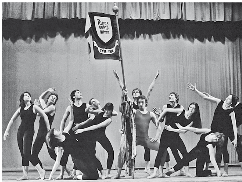
„Rīgas pantomīmas” dalībnieki