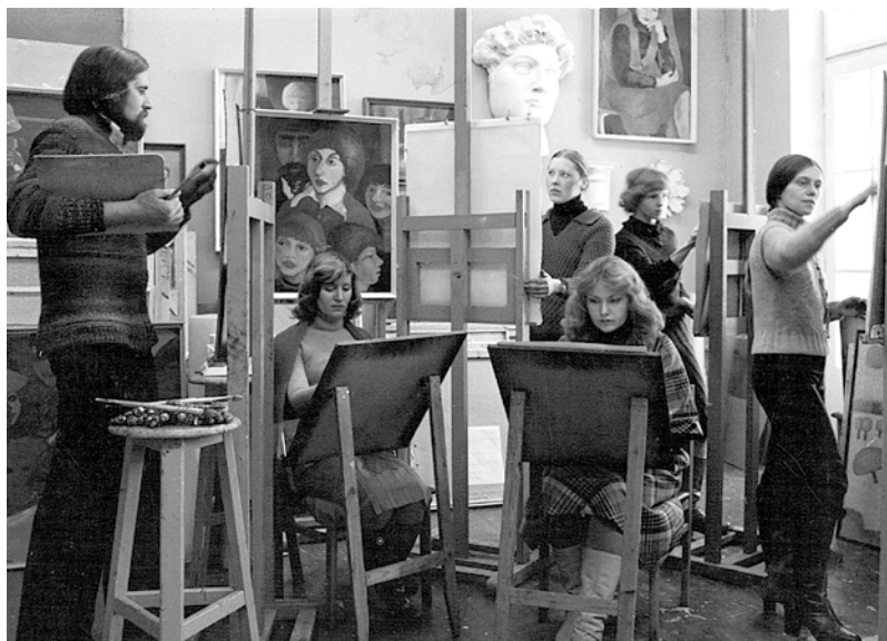
Glezniecības studija „Varavīksne”