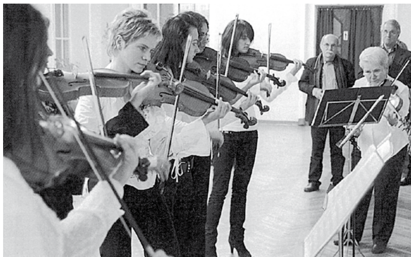
Vijolnieku ansamblis „Kantilēna” 2008. g.

Giberts [Giberts!] I. „Kantilēna” Maskavā : [par ansambļa