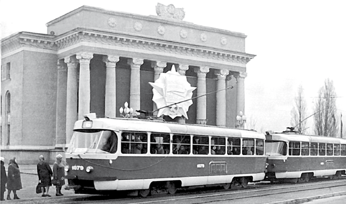
VEF Kultūras pils 1977. g.

Vasiļjevs J. Nākotnes Rīga : [arī par N. Semencova projektēto VEF Kultūras pili] / J. Vasiļjevs // Zvaigzne. – Nr.22 (1951), 25.-26. lpp.