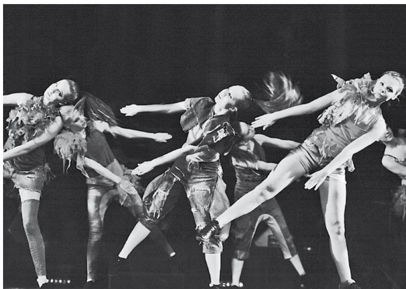
Deju grupa „Ritms”