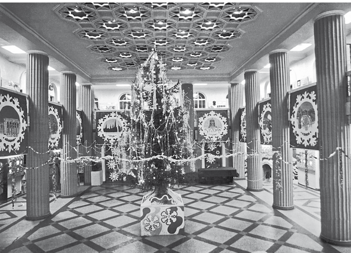
Vestibila noformējums Jaungadam 1968. g.

Gīberts I. Starptautiskās klases dejojāji Rīgā : [saruna ar starptaut. sarīkojumu deju konkursa galv. organizatoru, Kultūras pils direktora vietn. I. Gībertu] / pierakst. J. Bērziņš // Rīgas Balss. – Nr.266 (1969, 14. nov.), 5. lpp.