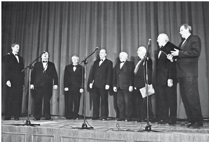
Kultūras pils vīru vokālais ansamblis 50 gadu jubilejas koncertā 2014. g.