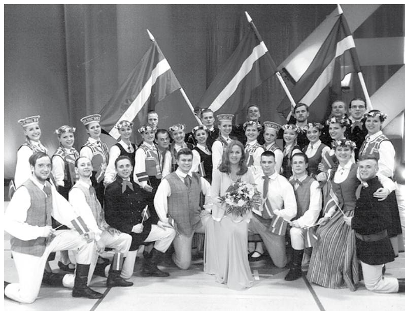
Deju kolektīvs „Bramaņi” 2015. g. Mākslinieciskā vadītāja Taiga Ludborža