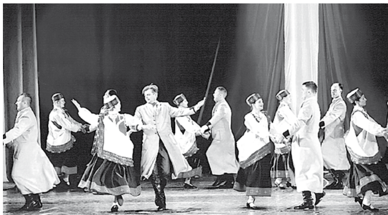
Vidējās paaudzes deju ansamblis „Gatve – otrā iespēja” 2010. g.