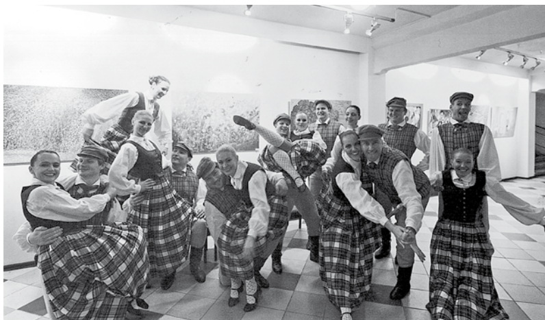
Deju kolektīvs „Videnieki”

Zvaigžņu stunda. Ja šobrīd kristu zvaigzne... : [stāsta arī „Videnieku” māksl. vad.] / Taiga Ludborža... [u. c.] ; mater. sagat.: Laura Dumbere, Santa Anča // Santa. – Nr.7 (2013, jūl.), 20.-23. lpp. : ģīm.