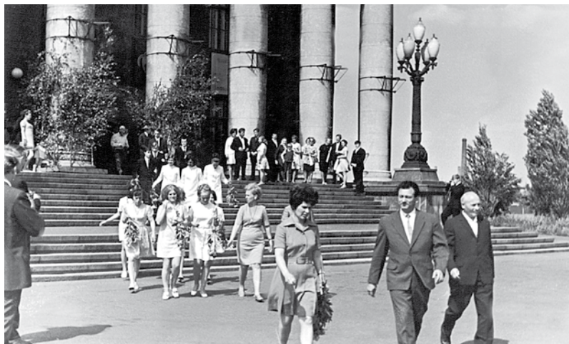
VEF darbinieku, tehniskās skolas audzēkņu pilngadības svētki

Diena labām domām : [par RD Labklājības depart. Kultūras pilī rīkoto pasākumu senioriem] // Atbalsts : avīze vecākai paaudzei. – Nr.12 (2014, dec.), 5. lpp.