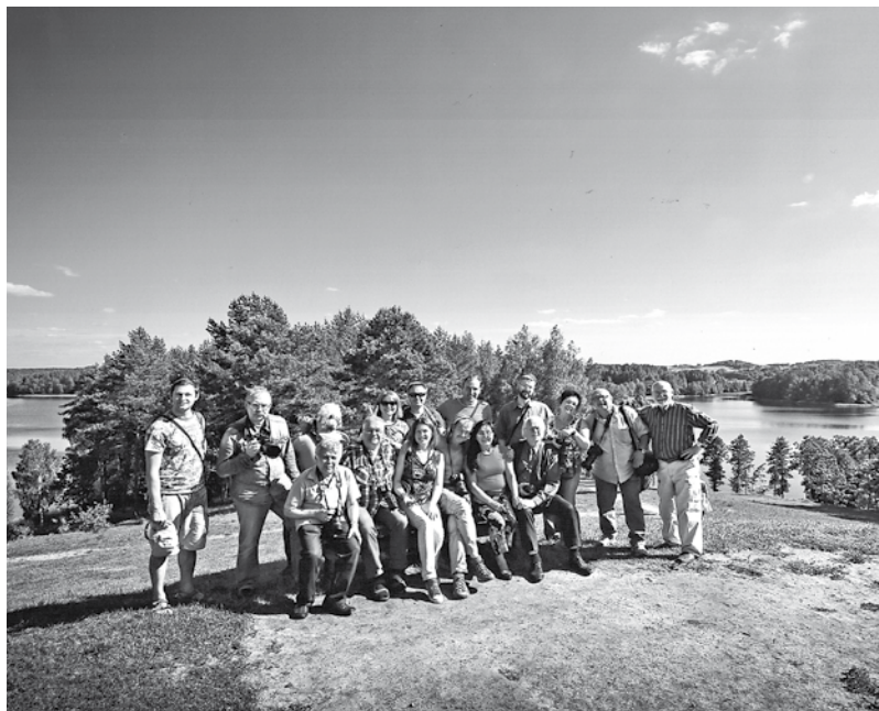
Fotostudijas „RVR” dalībnieki 2015. g.