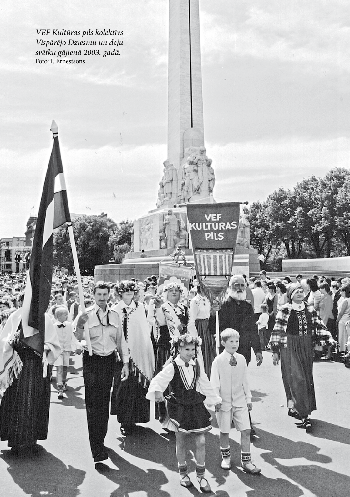
VEF Kultūras pils kolektīvs Vispārējo Dziesmu un deju svētku gājienā 2003. gadā.