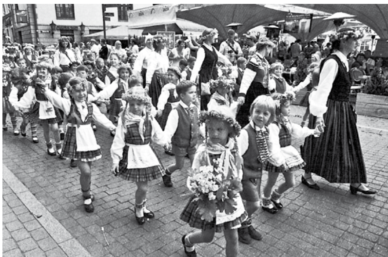
Tautas deju ansamblis „Zelta sietiņš” Dziesmu un deju svētku gājienā 2008. g.