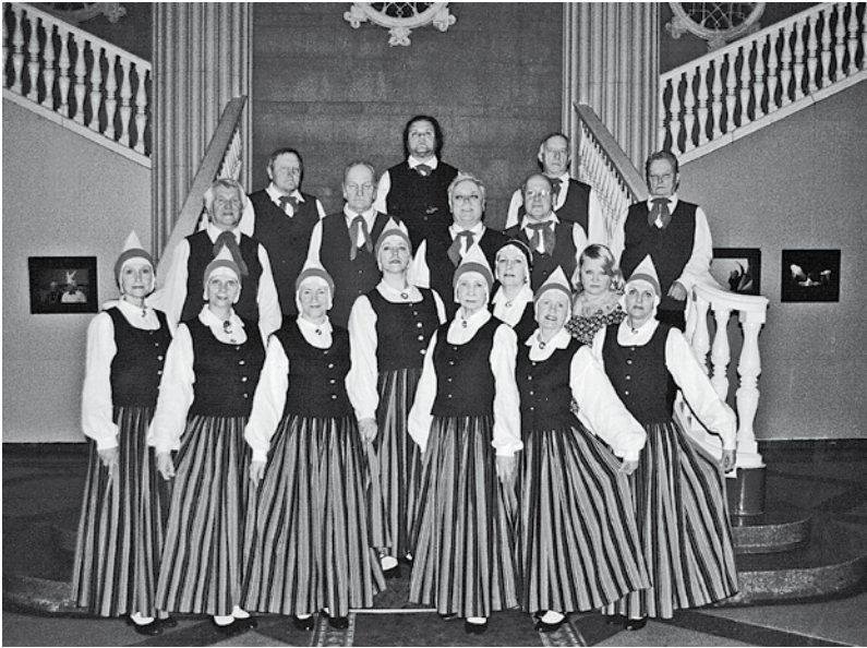
Senioru deju kolektīvs „Sendancis” 2015. g.